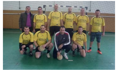
Az 1993-94-es ifjúsági csapat (kicsi változással)