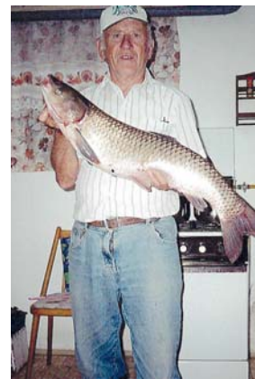
Horgászni azért van időm

mikor a sárba bele kellett állni, azt nem irigylte senki. De amikor jártuk a falut, vízórákat olvastunk, az is egy igénybevitel volt, lemászni az összes aknába, több helyen kitakarítani, mert voltak trehány em-