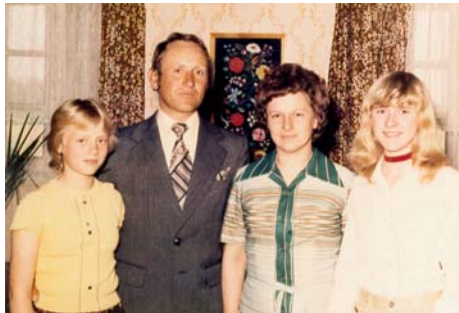
Feleséggel és lányaimmal

osztályomból 7-8-an voltunk kónyiak, de csak magam mentem oda. A többiek mondták is: elmész? Majd kitolnak veled! Én meg: Az igaz, hogy kemény lesz az öt hónap, de én azt irigylem, mikor a parancsnokaink oldalán egy térképtáska van, rajtunk meg a hátizsák, a gázlárc, és abban futunk-lótunk. Azok meg csak jönnek-mennek, adják az utasításokat. El is végeztem az öt hónapot századkitűnővel, ki is plakátoztak a falra. Egy ismerősöm is ott volt, az meg mondta: mennyi