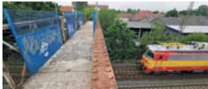
Felújítják a Rádda Barnen utcához közeli Tavasz utcai gyalogosfelüljárót.

A MÁV tájékoztatása szerint a 70-es vasútvonal felett Újpestre vezető hidat karbantar-