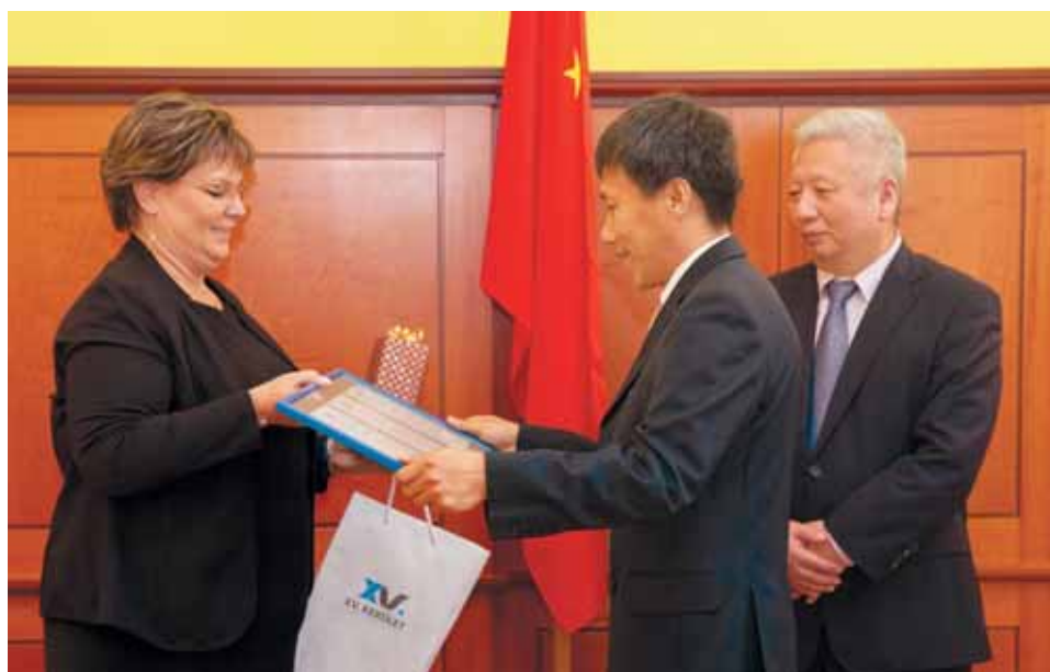
Támogatás a kerületből és külföldről | Cserdiné Németh Angéla oklevéllel köszönte meg a segítséget

A járványügyi védekezésben a kínai–magyar összefogás előtt tisztelgett a városrész. Duan Jielong, a Kínai Népköztársaság magyarországi nagykövete június 18-án ez alkalomból látogatott a XV. kerületbe.