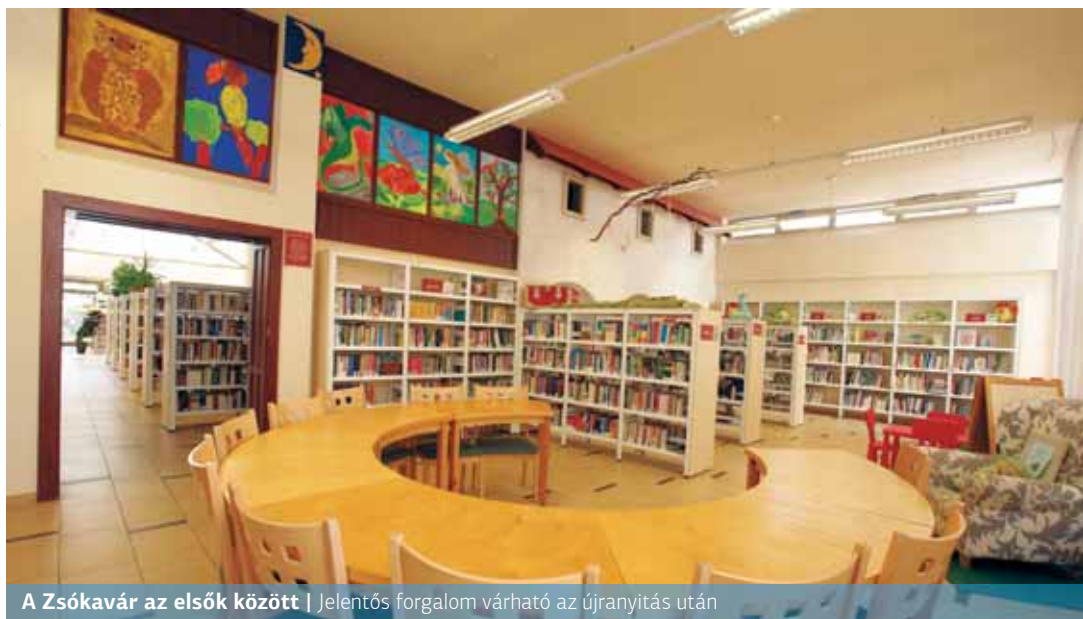
A Zsókvár az elsők között | Jelentős forgalom várható az újrainytás után

A XV. kerületben is jelentős a rendszeres könyvtárlátogatók száma. Számukra jó hír, hogy a tagkönyvtárak három ütemben nyitnak újra.