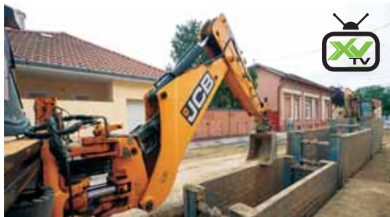
Többrétegű felújítás | Munkálatok a Batthyány utcában