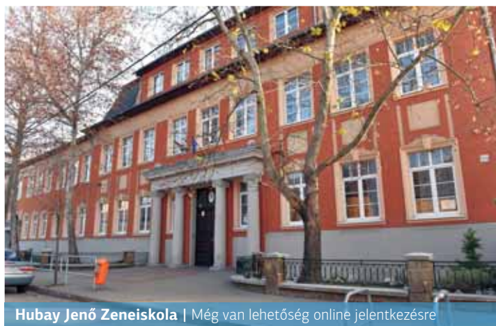
Hubay Jenő Zeneiskola | Még van lehetőség online jelentkezésre

A járványos időszak megváltozott körülményei új helyzetet teremtettek a zeneiskolai jelentkezésnél is. Ahogy Bokor György igazgató fogalmazott, más volt a lehetőség és más volt a bátorság a jelentkezők részéről. Ugyanis a korábbi évekhez képest idén lényegesen kevesebben jelentkeztek a zeneiskolába. Az elmúlt 3-4 évben évente mintegy 250 hallgató jelentkezett a különböző szakokra, most körülbelül százan