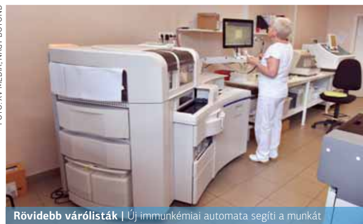
Rövidebb várólisták | Új immunkémiai automata segíti a munkát

A hamarosan „munkába álló” modern eszköznek köszönhetően az intézményen belül végezhető vizs-