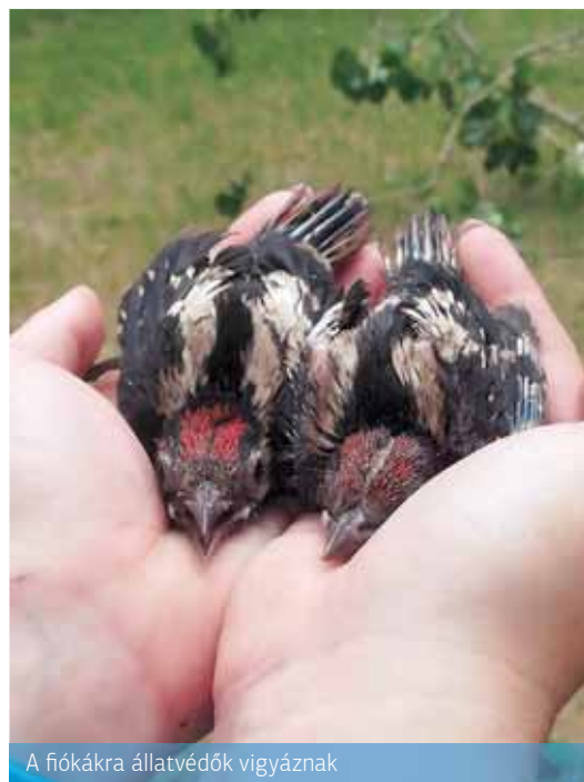
A fiókákra állatvédők vigyáznak

megerősödnek – ami néhány hetet vesz csak igénybe –, szabadon engedik majd őket – jegyezte meg a közterület-felügyelő. R. T.