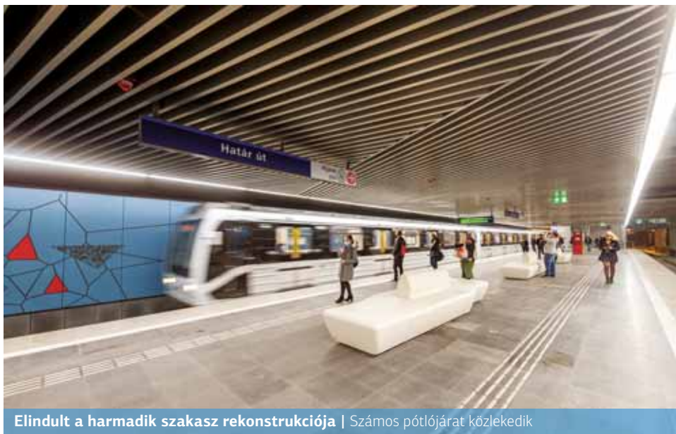
Elindult a harmadik szakasz rekonstrukciója | Számos pótlójárat közlekedik

A BKK a metró középső szakaszának felújítása idején is a legtöbb városrész felől bővíti a lezárt metrószakaszt elkerülő, közvetlenül a belváros vagy az üzemelő metróvonalak felé közlekedő járatok kínálatát. Ezért érdemes megfontolni, hogy úti célunkat ne feltétlenül a metrópótló buszokkal, hanem a nagy kapacitású, az északi és a déli metrópótlás során már megszokott alternatív utazási