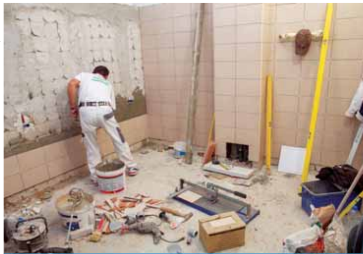
Korszerűsítés | Biztonságosabb és könnyebben tisztántartható felületek

A korszerűsítés szükségességét mi sem bizonyítja jobban, mint hogy a vizesblokkok helyiségeiben a falicsempek kopottak, helyenként repedtek, hiányosak, foltosak voltak, a javítgatások miatt foltokban eltérő színűek. A