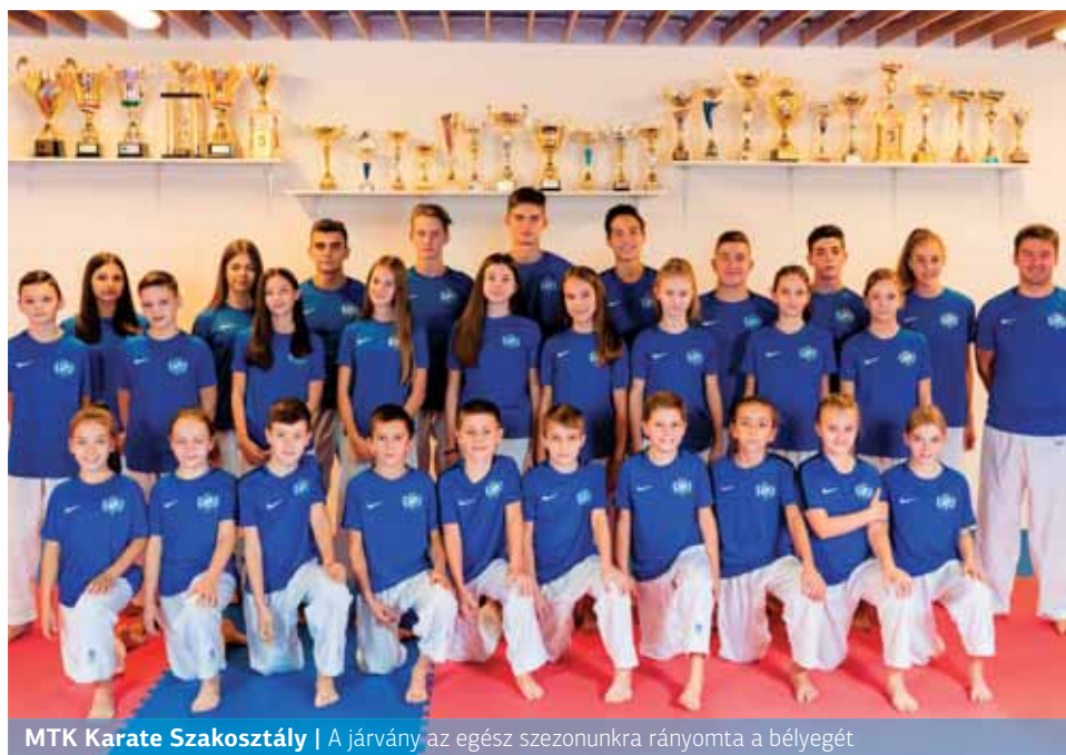
MTK Karate Szakosztály | A járvány az egész szezonunkra rányomta a bélyegét