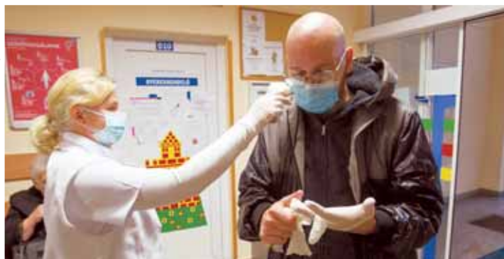
Óvintézkedések | Csökkentsük az orvosokkal való személyes kontaktust

A szakrendelő honlapját (xv-euint.hu) is érdemes követni az aktuális változások miatt. November 11-től ugyanis az intézmény valamennyi telephelyén és rendelőjében a rendeléseket 19 órától beszüntetik