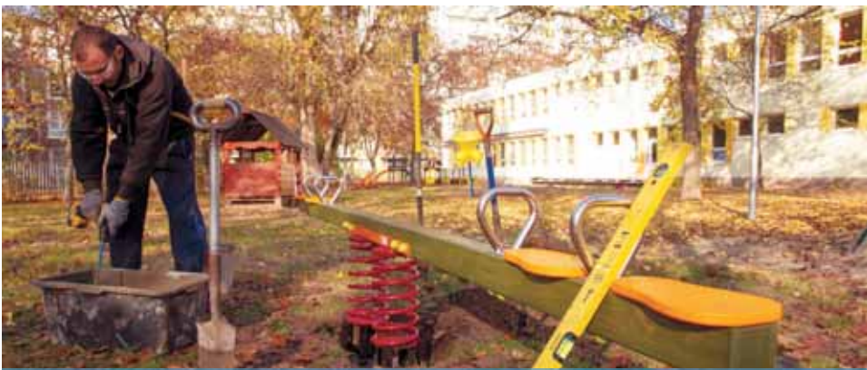
Biztonságosabb és zöldebb környezet | 78 új eszköz várja a gyerekeket

Végéhez közeledik a kerületi óvodákat és bölcsődéket érintő átfogó, ideai játszóeszköz-telepítés és udvarfejlesztés.