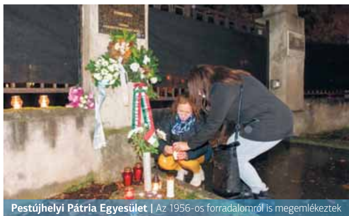
Pestújhelyi Pátria Egyesület | Az 1956-os forradalomról is megemlékeztek

Elmondta: az év nagy része a túlélésről szólt, szeptemberben azért si-