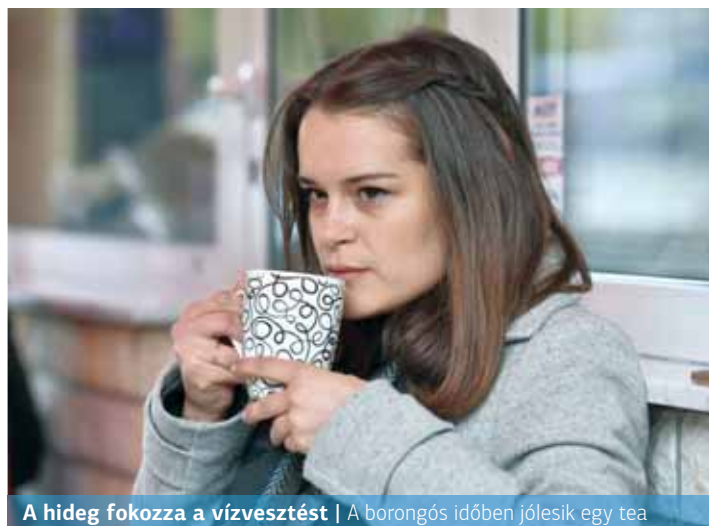
A hideg fokozza a vízvesztést | A borongós időben jólesik egy tea

Bár az őszi-téli szezonban talán kevésbé érezzük, a hideg időjárás is fokozza a vízvesztés mértékét. Télen a belélegzett levegő tipikusan alacsony, míg szervezetünk magas víztartalmú, a kilélegzett levegő páratartalma ezáltal magasabb, ami megnövekedett vízvesztéssel jár. Ez körülbelül 250-250 millilitert jelent naponta, de a ténylegesen elvesztett mennyiséget nagymértékben befolyásolják a környezeti viszonyok is, így a levegő hőmérséklete, páratartalma, a szélesség,