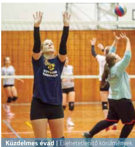
Küzdelmes évad | Ellehetetlenítő körülmények

A Palota VSN az NB II. Nyugati „B” csoportjában eddig három U21-es és egy NB II.-es felnőttcsapat ellen tudott pályára lépni. A TF és a Balatonfüred fiataljai ellen nyerni tudtak, az UTE korosztályos csapatától viszont vereséget szenvedtek. Ez utóbbi kalkulálható eredmény volt, hisz a lila-fehérek U21-ei kiemelkednek a mezőnyből. Majd nemrégiben Tatabányán NB II.-es rangadót játszottak a lányok, mely mérkőzésen csonka csapattal kellett jó eredményt elérniük.