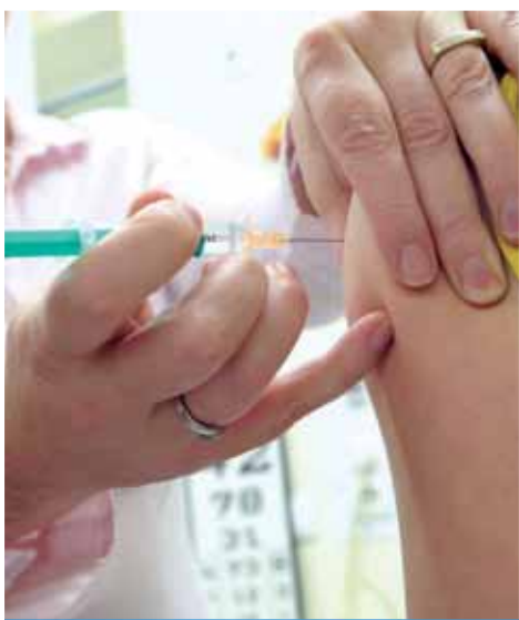
Infuenza | Öt-hét hónapig védettek lehetünk

– Most speciális helyzetben vagyunk, ezért, ha csak nincsen valamiért ellenjavallata, mindenkinek szorgalmazzuk. Már csak abból a megfontolásból is, hogy a koronavírus is hasonló tüneteket produkál, így inkább gondolunk majd arra, hiszen az influenza ellen már beoltották az illetőt.