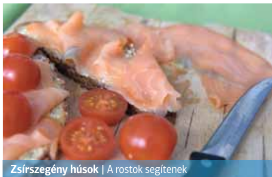
Zsírsegény húсок | A rostok segítenek

A laborleteken gyakran magas a koleszterin értéke, ami nélkülözhetetlen vegyület az emberi szervezet számára. Sejtmembránok, az epesavak, valamint egyes hormonok alkotóeleme. De mint az esetek többségében, a koleszterin kapcsán is igaz, a jóból is megárt a sok.