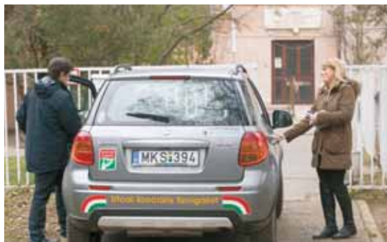
Körútra indulnak a Gondozó Szolgálat munkatársai

– Az Egyesített Szociális Intézmény Család- és Gyermejjóléti Központ keretein belül működő Utcai Gondozó Szolgálat a 2018–19-es téli krízisidőszakban – azaz 2018. november 1. és 2019. április 30. között hétköznapokon – a Twist Olivér Alapítvány munkatársainak ügyeleti idejével