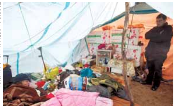
Szociális munkás egyik gondozottjakkal