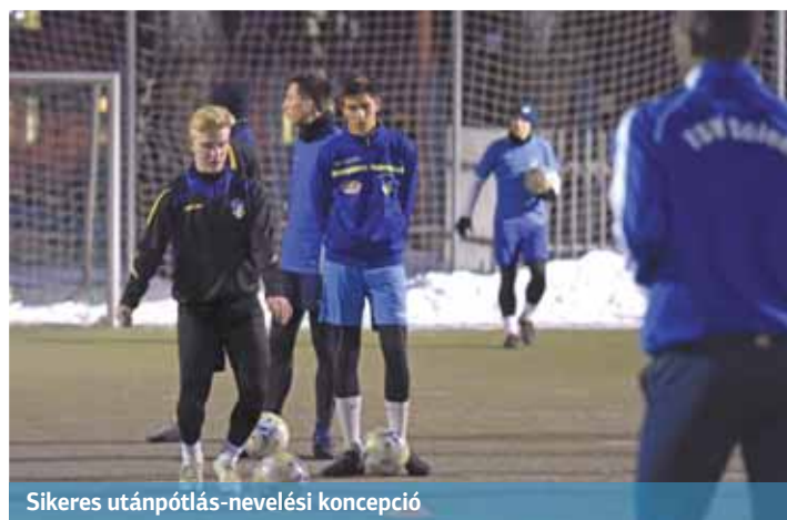
Sikeres utánpótlás-nevelési koncepció