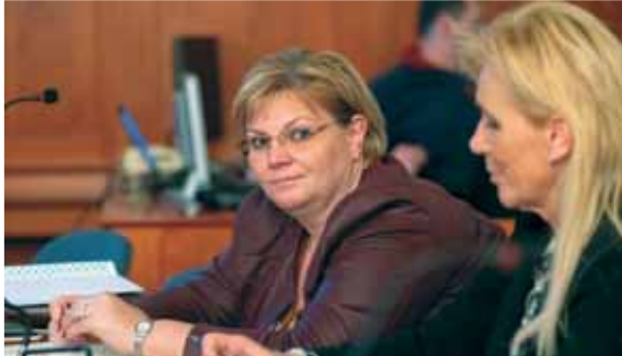
Németh Angéla polgármester

A kisebb civil szervezetek kétszáz ezer forintos egyszerűsített támogatást vezet be a Nemzeti Együttműködési Alap (NEA), a nagyobbaknál összevonják a korábbi működési és szakmai célú támogatást. Többek között ez is kiderült január 8-án a kerületi Civil Kerekasztal-beszélgetésen.