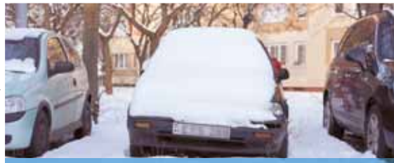
FELSZÓLÍTÁS A SZÉLVÉDŐN | Költséges szállítás

Évente átlagosan 700-800 közterületen hosszabb ideje álló, üzemképtelenné minősülő járművet derítenek fel a rendészeti osztály járőrei, ennek egy részét lakossági bejelentések alapján. A közterület-felügyelők mindig