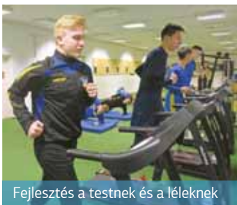
Fejlesztés a testnek és a léleknek

sori helyiségben tudtunk maximum egy-két gyerekkel erősíteni. De azon a helyiségen is osztoznunk kellett a súlyemelő-szakosztályunkkal.