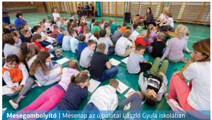
Mesegombolyító | Mesenap az újpalotai László Gyula iskolában