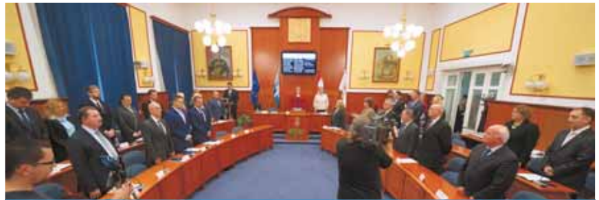
A képviselők leteszik az esküt

Megtartotta alakuló ülését a képviselő-testület október 29-én. A megbízólevelek átvételét és az esküteteleket követően a képviselők megválasztották az alpolgármestereket.