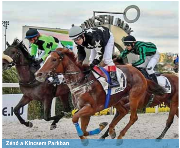
Zénó a Kincsem Parkban