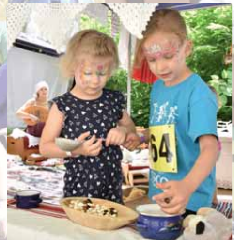
Családi nap | Változatos programok