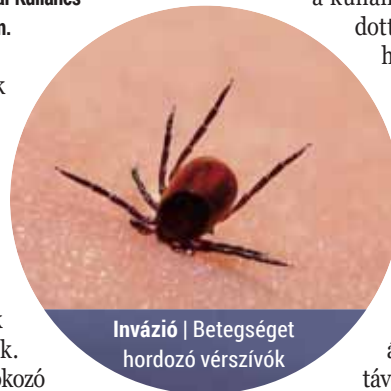
Invázió | Betegséget hordozó vérszívó