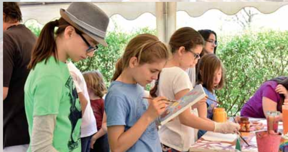
Fest a kerület | Az iskola hagyományos programja