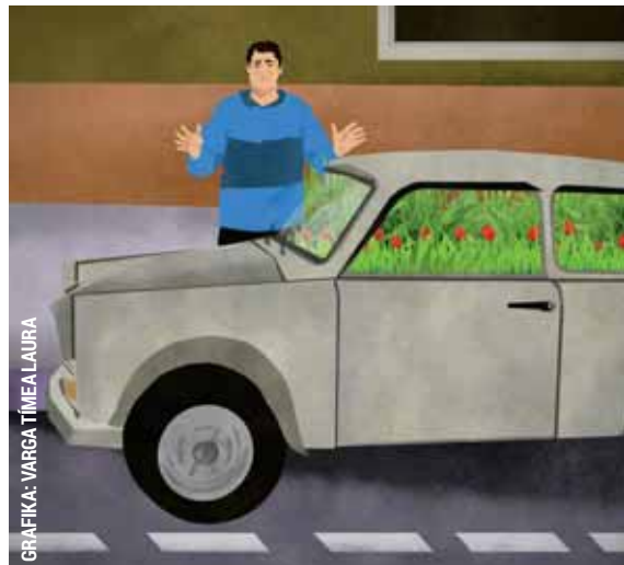
GRAFIKA: VARGA TIMEALORA

Egy autóvezetőt igazoltattak a rendőrök a Népfelkelő utcában. A jármű utasterében három papírba csomagolt, zöld színű növényi törmelékkel találtak, melyekről az autó vezetője úgy nyilatkozott, hogy az marihuána. A férfival gyorstesztet csináltattak, ami pozitív eredményt mutatott, ezért kábítószer birtoklása miatt indult eljárás ellene. R. T.