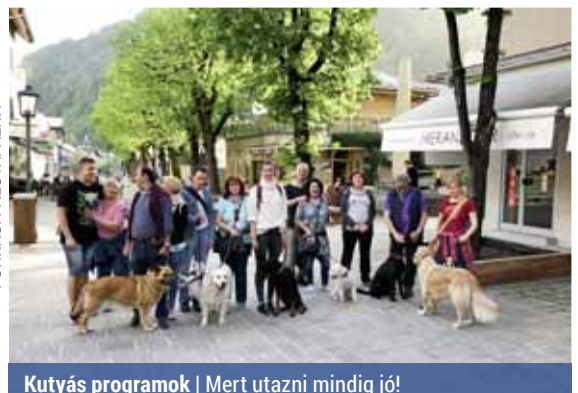
Kutyás programok | Mert utazni mindig jó!

pincsi), a gazdáik sem egyformák. Van köztük diák, nyugdíjas, a divatszakmában, az egészségügyben, a vendéglátásban dolgozó, gyerekekkel foglalkozó más autószerelő gazda is. A Palotafalka útja nagyon jól sikerült, bejárták Tirolt, túráztak a Krimml-vízesés-