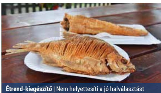
Étrend-kiegészítő | Nem helyettesíti a jó halválasztást

A 79 korábbi kutatás eredményeit összegző vizsgálat