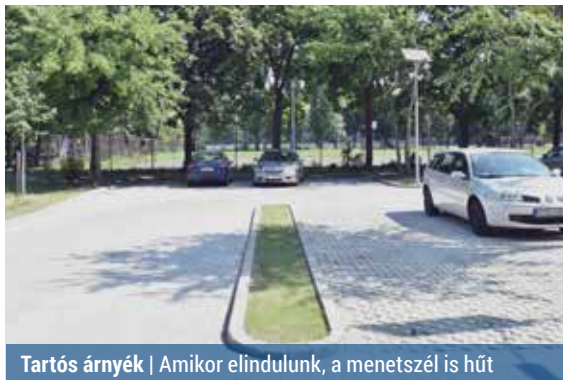
Tartós árnyék | Amikor elindulunk, a menetszél is hűt

Bár kifelé jövünk a nyárból, a hőség nem enyhül. Jól tudjuk, milyen érzés a forró autóra beülni, és várni arra az 1-2 percre, amíg elkezdjük érezni a légkondi áldásos hatását. Vannak azonban praktikák a klíma beindításán túl, amelyek megkönnyítik helyzetünket.