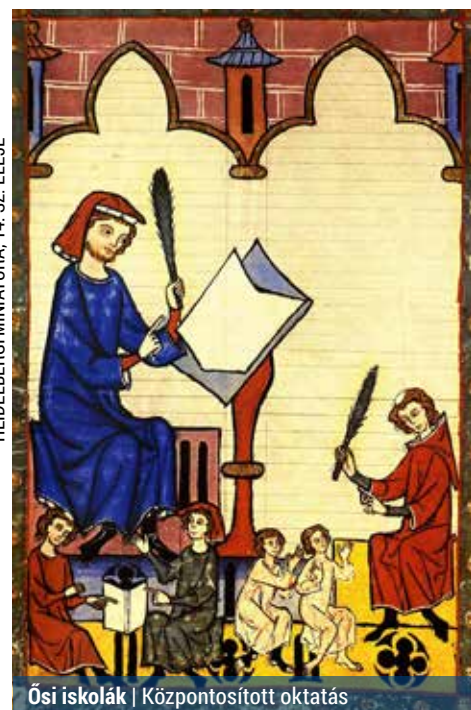
HEIDELBERGI MINIATŰRA, 14. SZ. ELEJE

Az állam az iskolák ügyét a XVIII. század második felében, a felvilágosult abszolutizmus idején kezdte felkarolni. Hazánkban a tanügyi reformot osztrák és magyar tanügyi szakemberekkel Mária Terézia indította el az 1600-as évek végén. Az általuk kidolgozott Oktatási-Nevelési Rendszer, a Ratio Educationis 1777-ben jelent meg. Ez volt az első hazai kísérlet arra, hogy állami felügyelet mellett egységes iskolarendszert építsenek ki, amelynek része volt a kötelező iskolalátogatás. B. I.