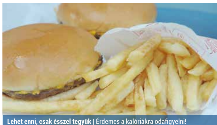
Lehet enni, csak ésszel tegyük | Érdemes a kalóriákra odafigyelni!

Nem a világ vége, ha valamilyen fast food étteremben kell elköltenünk az ebédünket/vacsoránkat. Csak annyira figyeljünk, hogy ne veszítsük el a kontrollt a magas vagy extrém magas kalóriatartalmú, inycsiklandozóan talált fogásokat látva. Bár a nagy energiasűrűségű ételek nagyobb választékban vannak a kínálatban, azért a legtöbb étteremben találunk alternatívát.