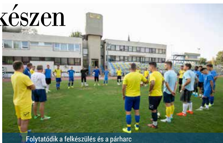
Folytatódik a felkészülés és a párharc