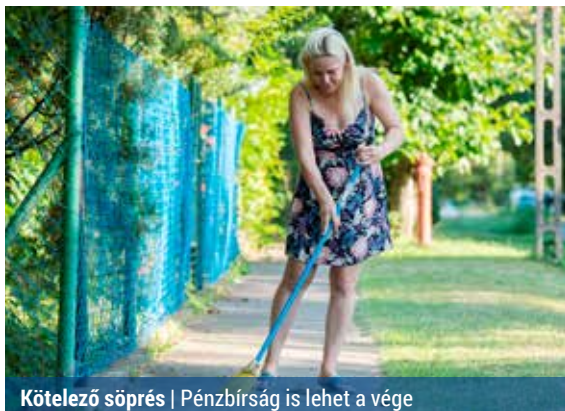
Kötelező söprés | Pénzbírság is lehet a vége

– Általános tapasztalat, hogy nyáron és ősszel kevesebb gondot fordítanak a járda tisztán tartására a tulajdonosok, pedig a fákról lepotyogó virágok, termések, az ősszel lehullott nedves falevél rendkívül csúszós, éppen ezért balesetveszélyes. Egy esetlegesen bekövetkező balesetért pedig az ingatlan