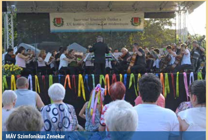
MÁV Szimfonikus Zenekar