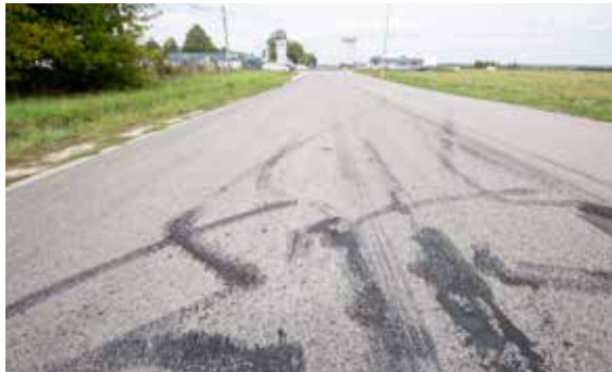
Tombol a tesztszteron | Mások nyugalma nem számít

– A panaszok hozzánk is eljuttattak. Mostanában leggyakrabban a Szentmihályi útról, illetve a Városkapu utcából, M3-Szilas-pihenő jeleznek ilyen versenyeket. Előfordul, hogy a gyorsulók a Pólus parkolójában gyülekeznek, de pont azért, mert odafigyelünk rájuk, gyakran változtatják a találkozási pontjaikat – mondta a szakember.