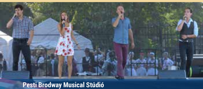
Pesti Broadway Musical Stúdió