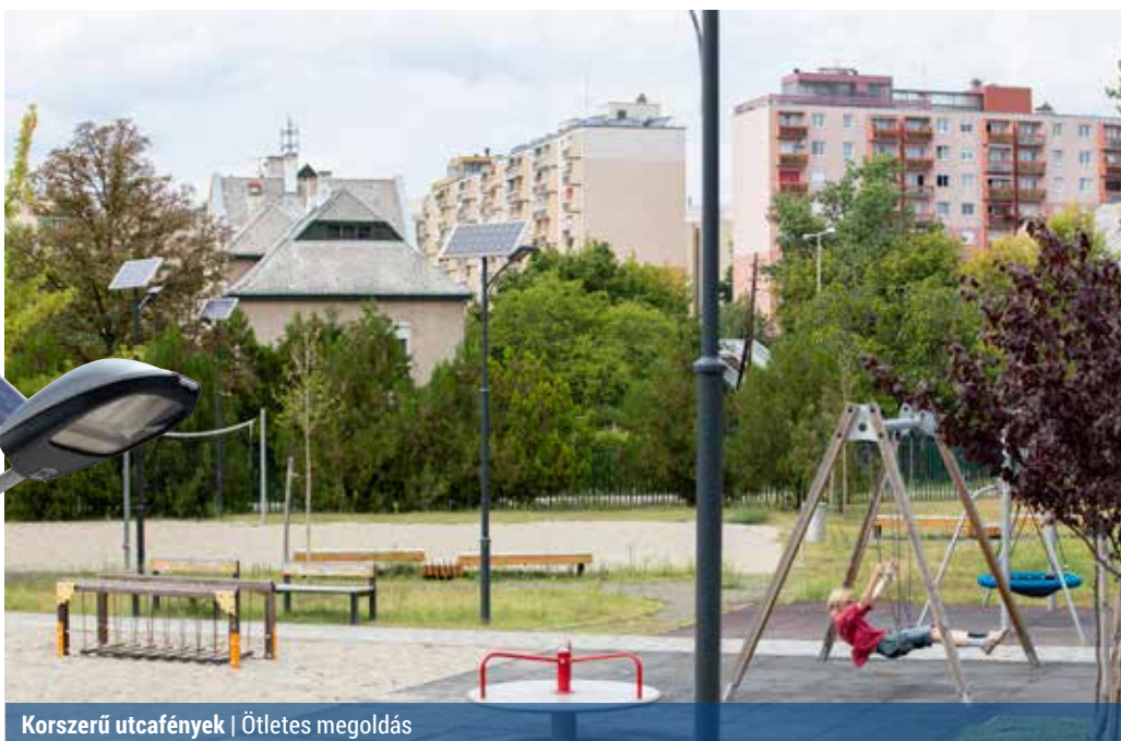
Korszerű utcafények | Ötletes megoldás

„A napelemes kandeláberetek beváltották a hozzájuk fűzött reményeket.”