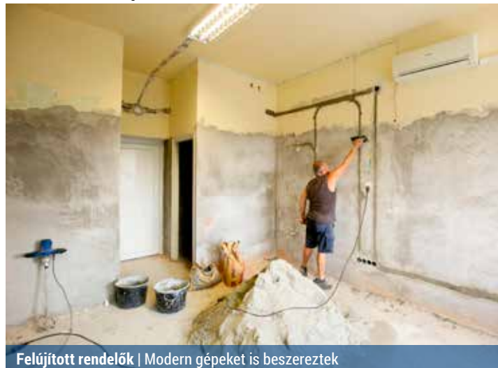
Felújított rendelők | Modern gépeket is beszerettek