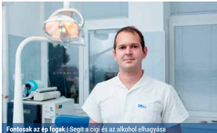
Fontosak az ép fogak | Segít a cigi és az alkohol elhagyása

Szeptembertől folytatódik az egészségügyi szűrőprogram a kerületben. Ezúttal orvosaink egy olyan területen – szájrégi rákszűrés – próbálják majd megelőzni a bajt, amely már tavaly is terítéken volt.