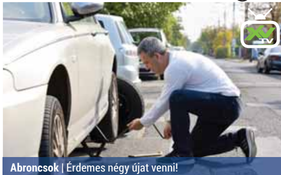
Abroncok | Érdemes négy újat venni!

A korábbi évekhez képest korábban, már szeptember végén elkezdődött a téligumibroncs-csere szezonja – adta hírül az MTI.