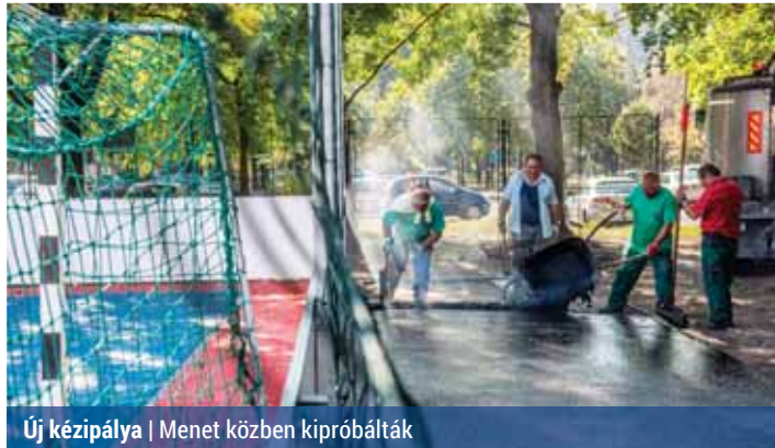
Új kézilabdapálya | Menet közben kipróbálták