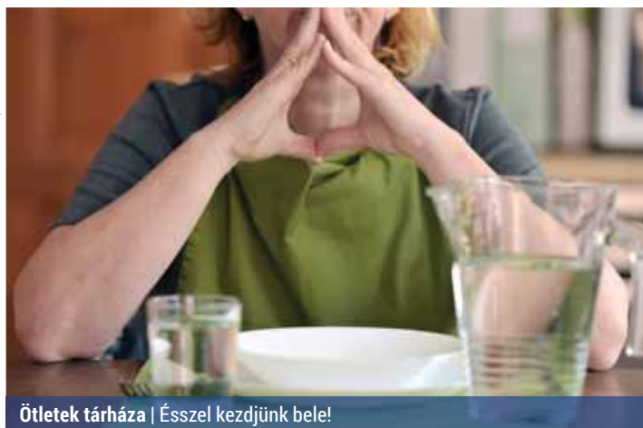
Ötlepek tárháza | Ésszel kezdünk bele!

Igen színes palettából válogathat az, aki böjtölésre adja a fejét; a különböző léböjtűkről kezdve a folyamatos, illetve szakaszos böjtökön át a teljes táplálék- vagy akár folyadékmegvonásig mindenféleképpen találkozhat.