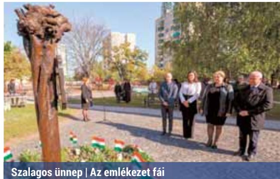
Szalagos ünnep | Az emlékezet fái

A XV. kerületben – azon belül Rákospalotán – nemcsak 169 évvel ezelőtt voltak szabadságpártiak az emberek, hanem ma is méltóképpen ápolják a hősök emlékét. A Batthyány Emlékkertet 2002-ben alapította az önkormányzat – a Kossuth utcában, közvetlenül a Kos-