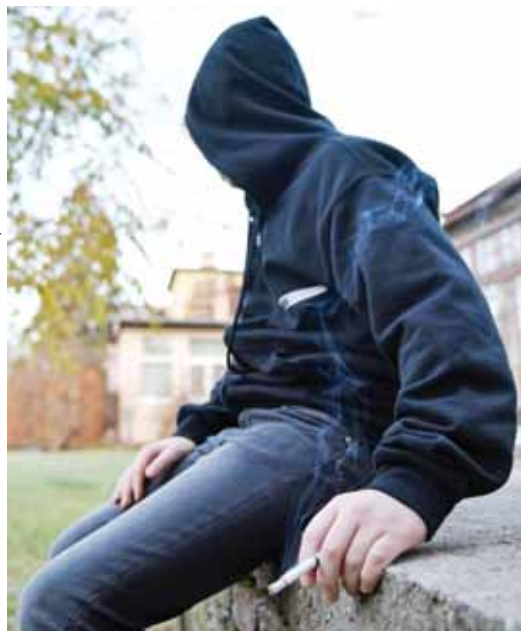
Korai dohányosok | Függőség tizenévesen

Ez a korosztály nagyon nyitott a technikai újdonságokra, így mindenki ismerte az elektromos cigarettát, bár nagyon megosztanak róla a vélemények. A válaszok