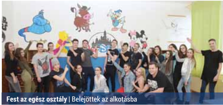
Fest az egész osztály | Belejöttek az alkotásba

Mesés teremmel gazdagodott a Kontyfa iskola. Az egyik 12. évfolyamos osztály ugyanis mesefigurákkal festette tele az osztogatos diákok egyik tantermét.