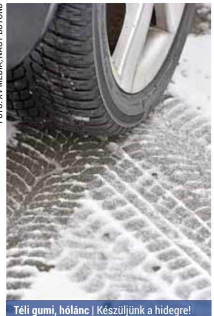
Téli gumi, hólánc | Készüljünk a hidegre!

Ellenőrizzük, hogy a csomagtartóban megvan-e az egyébként kötelező pótkerék, az izzókészlet, az elakadásjelző háromszög, az elsősegélydoboz, valamint tegyük be emelőt, kerékkulcsot, vontatókötelet, zseblámpát, plédet, lapátot, és az utasok számával megegyező mennyiségű láthatósági mellényt.