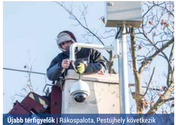
Újabb térfigyelők | Rákospalota, Pestújhely következik

A napokban tehát térfigyelő kamera kerül a Károlyi Sándor utca – Pozsony utca, a Károlyi Sándor utca – Székely Elek utca, a Külső Főti út – Felsőkert utca, a Bánkút utca – Szerencs utca, a Szerencs utca – Pöntenberg Ernő utca, a Kolozsvár utca – Széchenyi út, az Ady