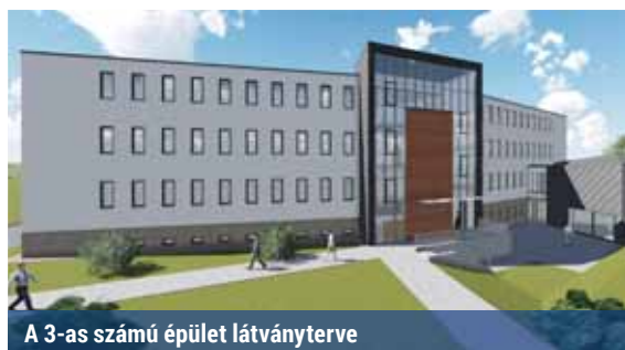
A 3-as számú épület látványterve

Azzal viszont egyetértettek a képviselők, hogy a Vasgolyó utca aszfaltozásához kormányzati támogatást igényeljen kerületünk. A Miniszterelnökség a központi költségvetésből 10 milliárd forintot biztosít vissza nem