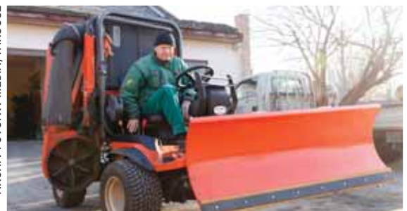
Készenlét | Elsők az intézmények

tányok, gyalogutak síkosságmentesítésénél is ugyanezt az elvet követik.