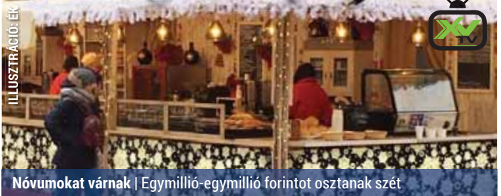
Nóvumokat várnak | Egymillió-egymillió forintot osztnak szét