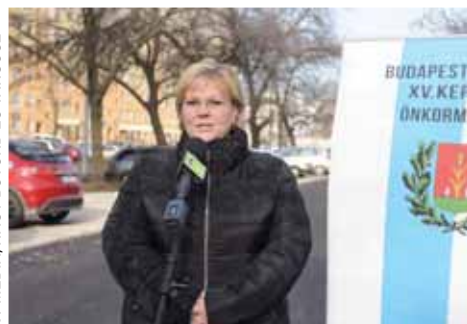
A Nyírpalota úti 81 állásos parkoló átadóján december 14-én