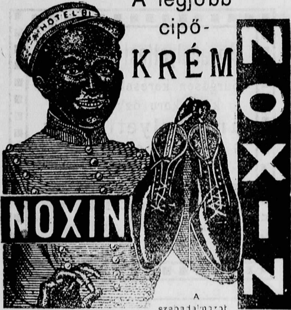
A szabálmintát kulocsal!