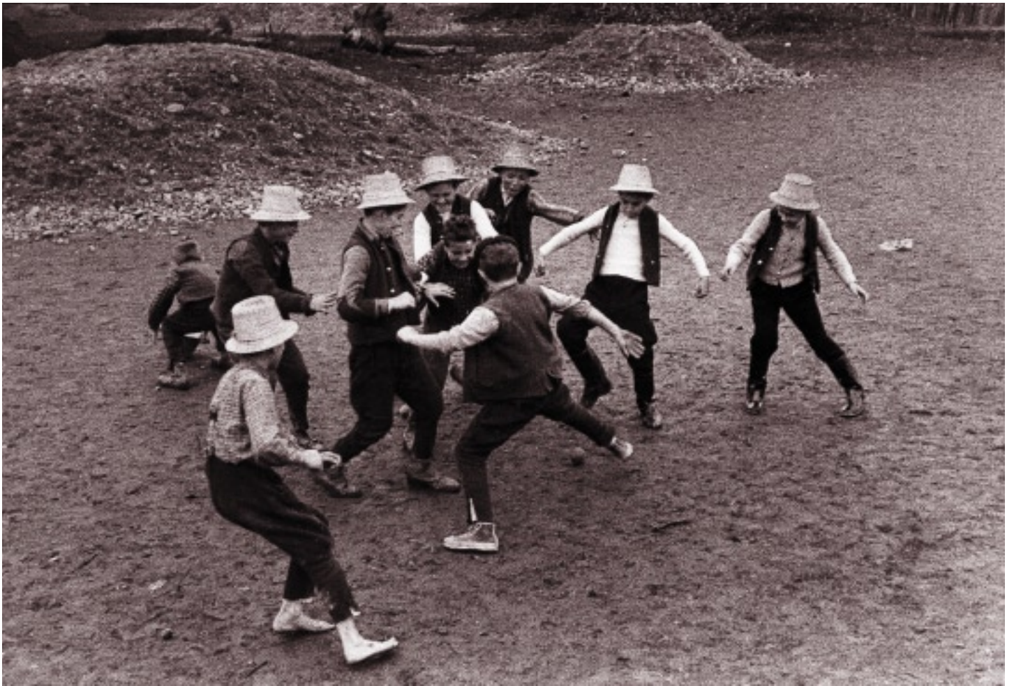
Futballozó fiúk (1967)