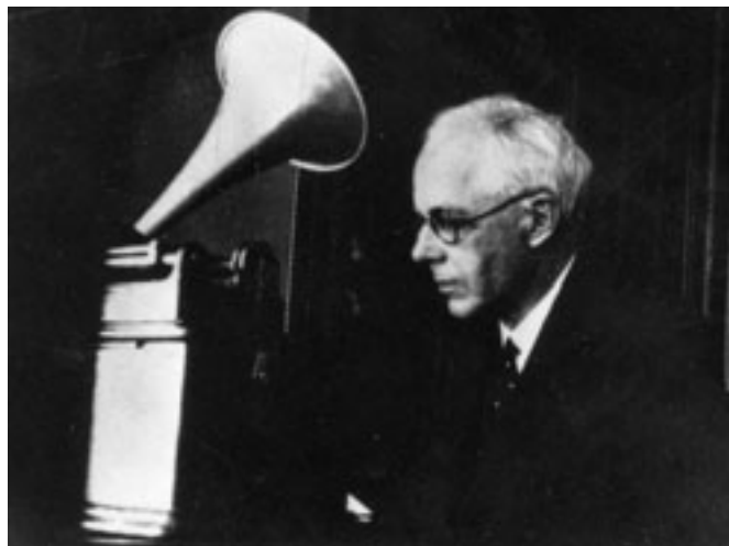
Bartók Béla a Román Zeneszerzők Társasága Folklor-archívumában (Bukarest, 1934)

„Tagadhatatlan, hogy a népdalkutatás, valamint általában minden népművészeti tanulmány megindulásának ösztöké- jét a nemzeti érzés felébredésében kell keresnünk. A népköl- tési és népzenei kultúrártékek felfedezése feltűzelte a nemze- ti büszkeséget s mivel összehasonlításra kezdetben semmiféle mód sem volt, minden nemzet fiai azt gondolták, hogy ilyen- fajta kincsek birtoklása az ő egyedüli és legsajátabb kiváltsá- guk. Kisebb, különösen pedig a politikailag elnyomott nem- zetek ezekben a kincsekben bizonyos fokig vigasztalást talál- tak, öntudatuk megerősödött, megszilárdult; ezeknek az érté- keknek tanulmányozásában és közzétételében alkalmas eszkö- zük volt arra, hogy a nemzet műveltebb rétegének a nemzeti