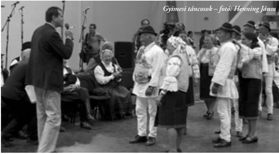
Gyimesi táncosok – fotó: Henning János

dom, hogy az erdélyi táncház erősen hasonlít egy nagy bolondérikus családhoz. Megannyi különböző korú, szakmájú és akár a világ végére sodródott ember közös fogózkodója. Közös Ház, ahol mindig történik valami, s azt valahogy – akár távolból is – közösen éljük meg.