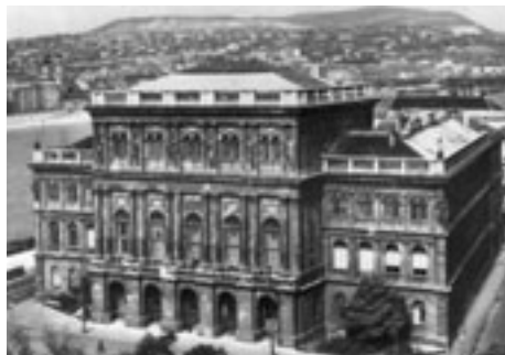
A Magyar Tudományos Akadémia épülete, ahol Bartók népzenei rendszerezőmunkáját végezte 1934-től

is – már akkor – valamilyen ázsiai zenekultúra nyomait sejtettük a mi pentatóniánkban. És íme, a nemrég megismert Volga menti cseremiszi dallamok jórésze akkori sejtésünket igazolja: ugyanazt a pentaton rendszert, ugyanazt az ereszkedő dallamszerkezetet, sőt még magyar dallamok változatait is találjuk bennük. Hogyan és mivel magyarázhatók ezek az egyezések? Milyen úton-módon maradt fenn sok-sok évszázadon át, egymástól több ezer km-nyire szétdobott népeknél egy és ugyanaz a zenekultúra? Ezekkel a kérdésekkel a népdalkutatás