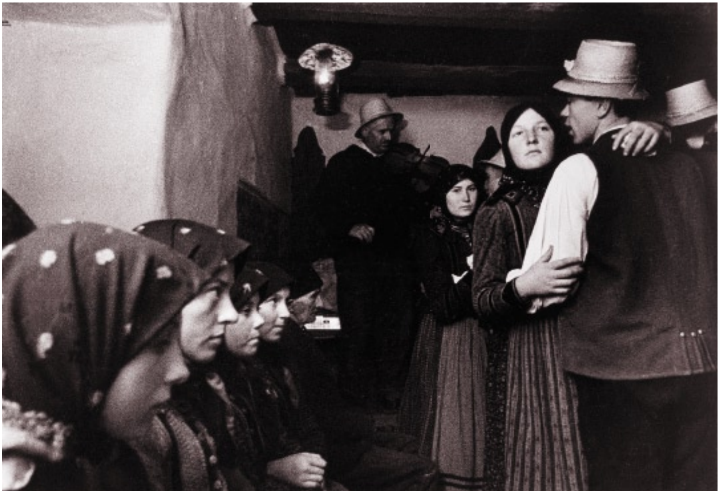
A táncbázisban (1967)