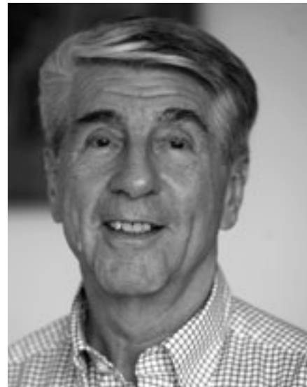
Korniss Péter

Arra törekedtem, hogy elfogadjanak az emberek. A pusztá megszokás nem lett volna elég ahhoz, hogy természetesnek vegyék ottlétemet s a fényképezőgép kattánásait. Érezniük kellett, hogy érdekel a sorsuk – hiszen ezért fényképeztem őket –, s érezniük kellett a tapintatot is, amellyel ezt tettem. A rokonszenv láthatatlan szálainak kellett szövődniük, hogy otthonosan mozoghassak közöttük. Robert Capának, a legendás hírű magyar származású fotográfusnak volt a mondása: ha nem elég jó a képed, nem voltál elég közel a témához. Magam számára így módosítottam: ha nem elég jó a képed, nem voltál elég közel az emberhez.