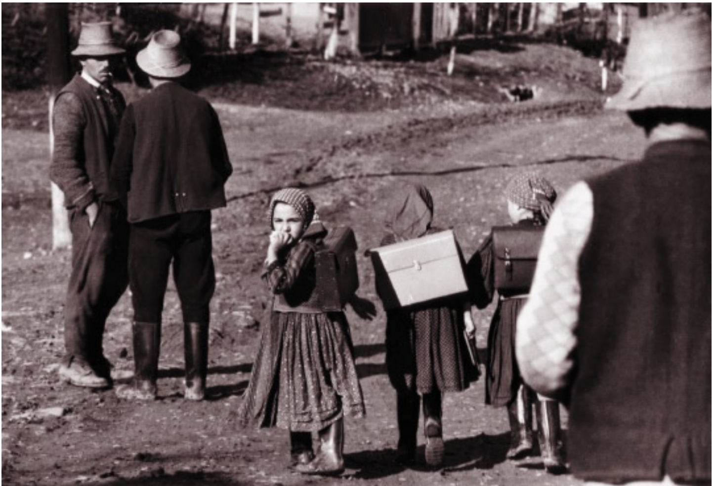
Haza felé (1967)