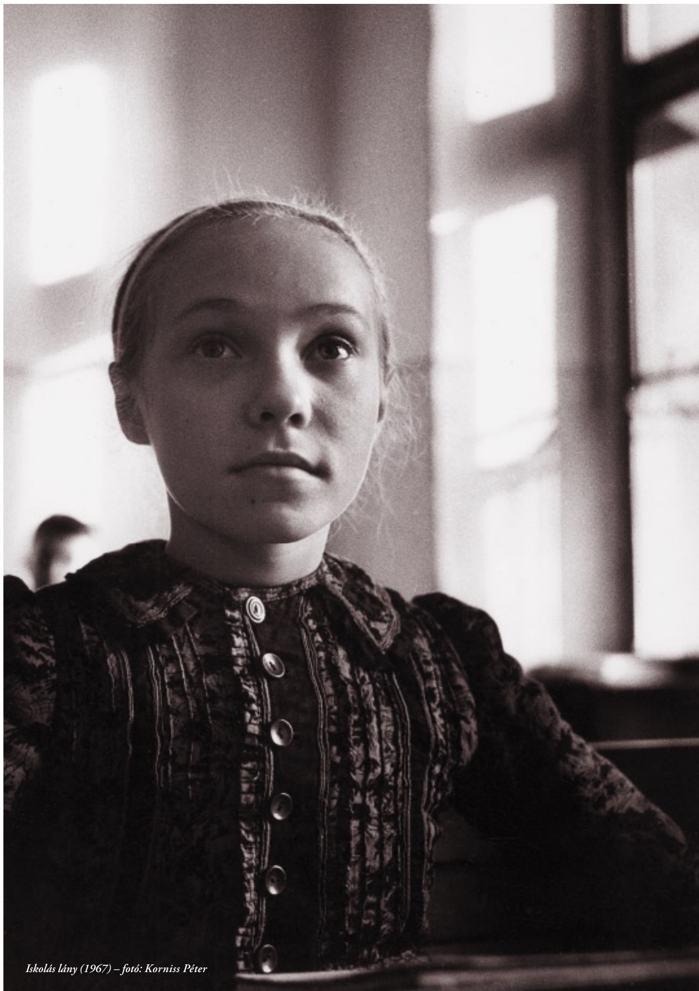
Iskolás lány (1967)