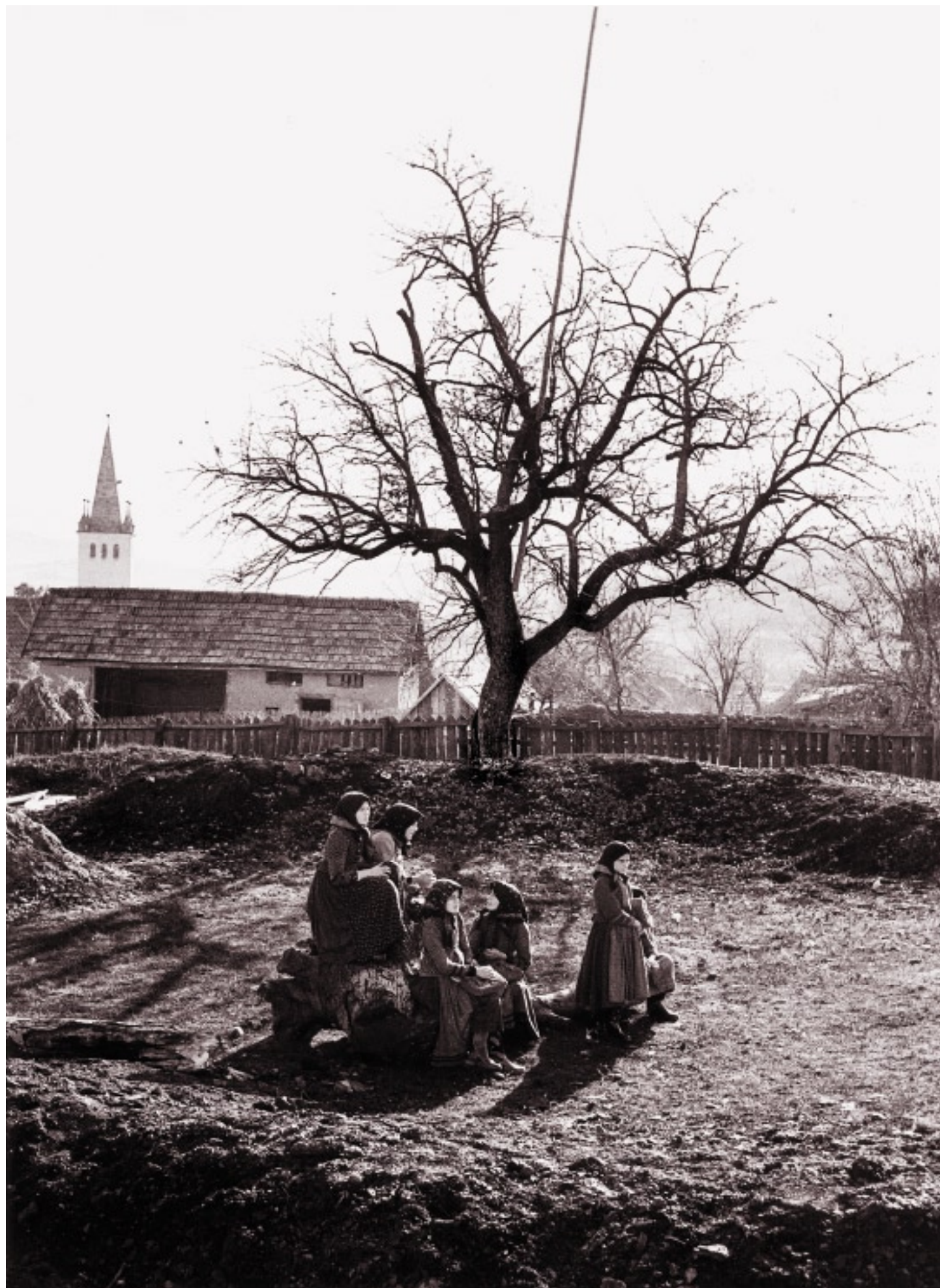
Széki lányok iskola után (1967)