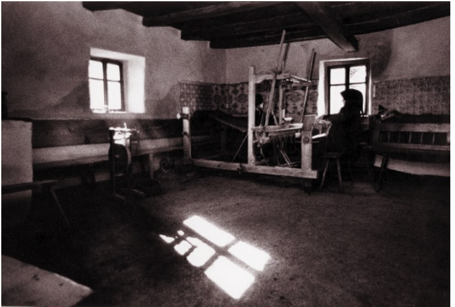
Kali néni szobája, ahol a táncbázis rendezték Felszegen (1967)