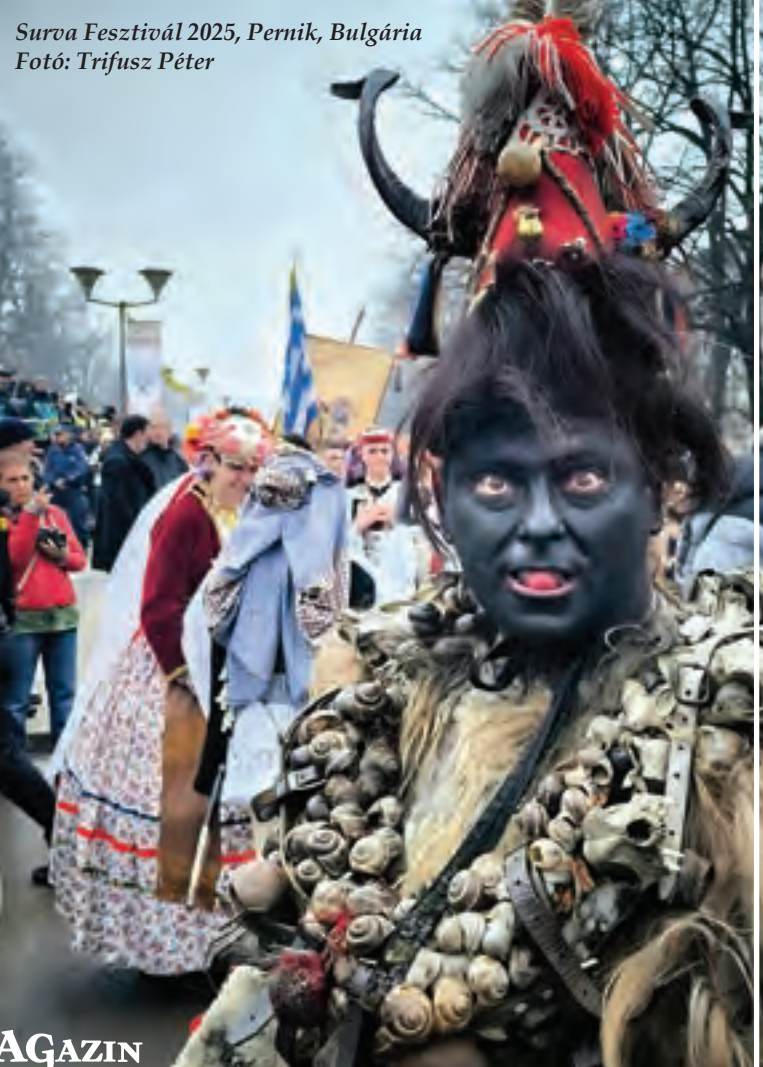
Surva Fesztivál 2025, Pernik, Bulgária