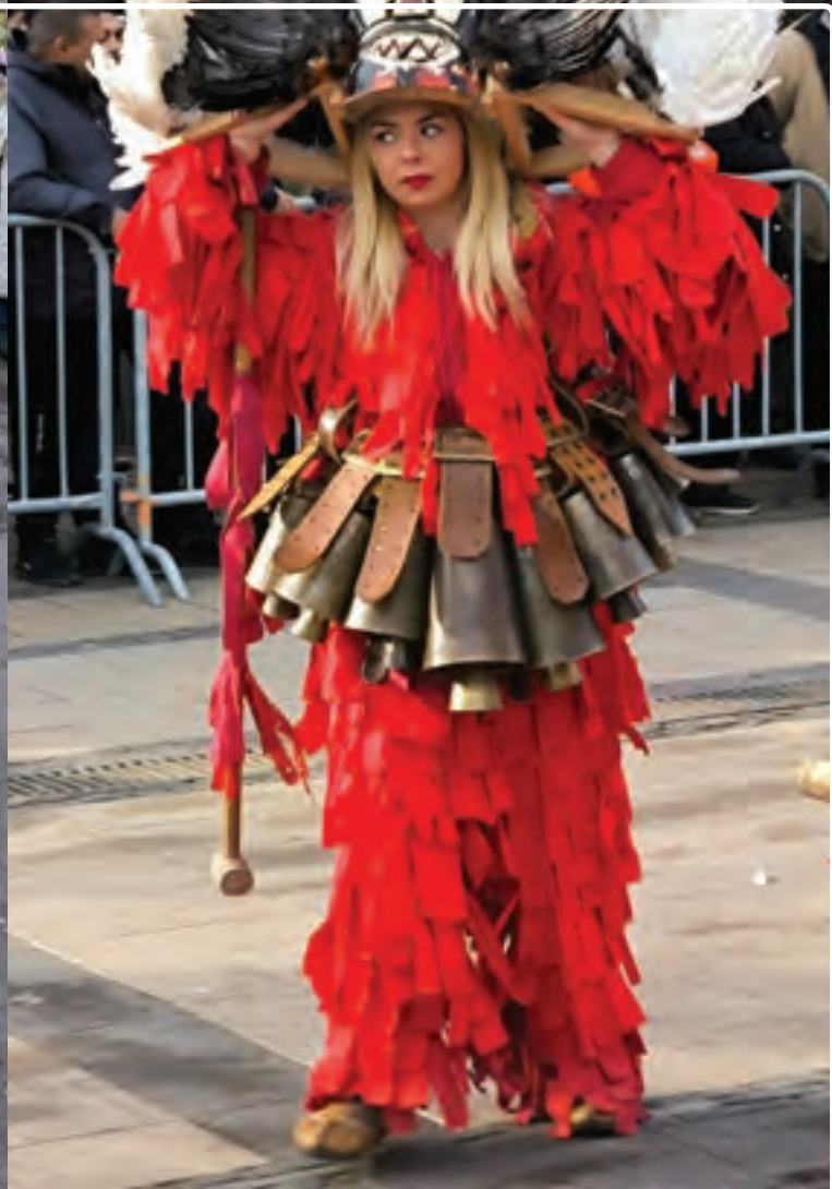
Surova Fesztivál 2025, Pernik, Bulgária