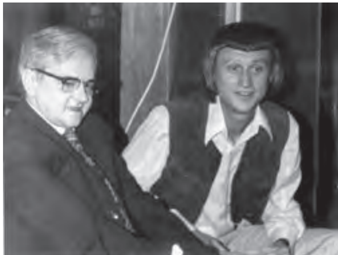
Weöres Sándor és Czakó Gábor

Jelen folytatásunkban az egyik kedvenc vendégünk, favorizált költőnk Weöres Sándor 1975-ös látogatásáról fogok beszámolni. Két tánc között, a szünetben beszélgettünk vele. A társalgást, amelyről magnófelvétel is készült, az akkor még fiatal író, Czakó Gábor vezette.