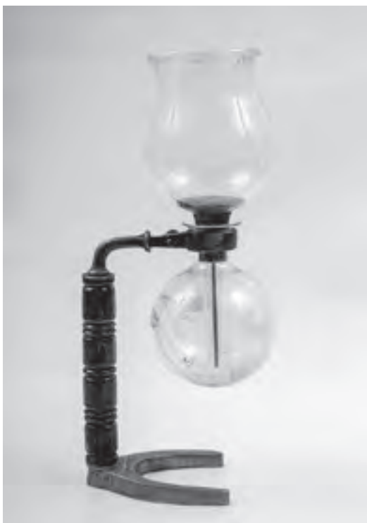
XX. sz. eleji lombikos kávéfőző