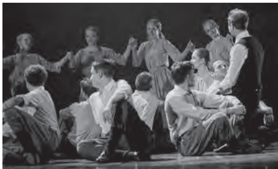
Foltin Jolán: Gyerekjátékok