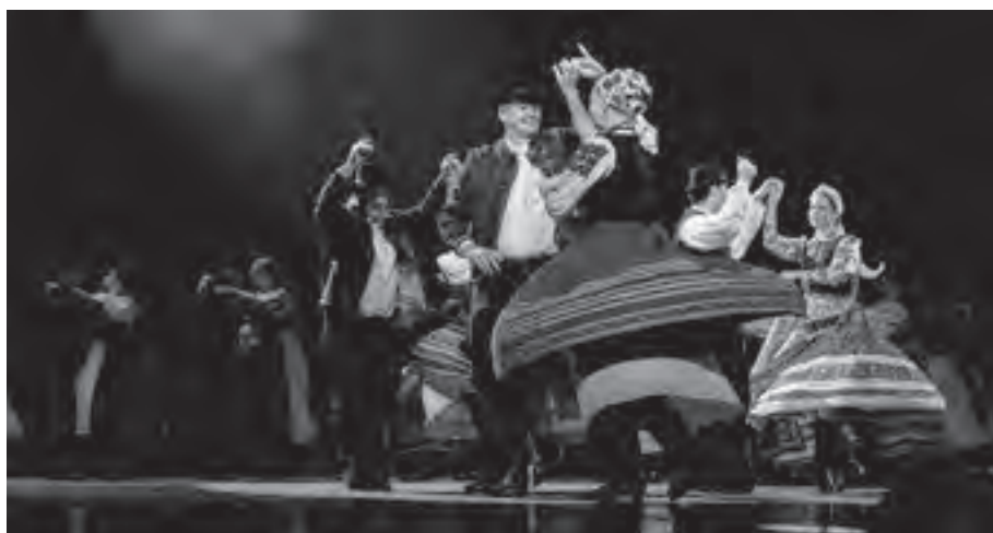
Kalotaszegi táncok

lemi-elméleti műhely, mint gyakorlati, koreográfusokat alkotó, azokat színpadra vivő néptáncegyüttes.