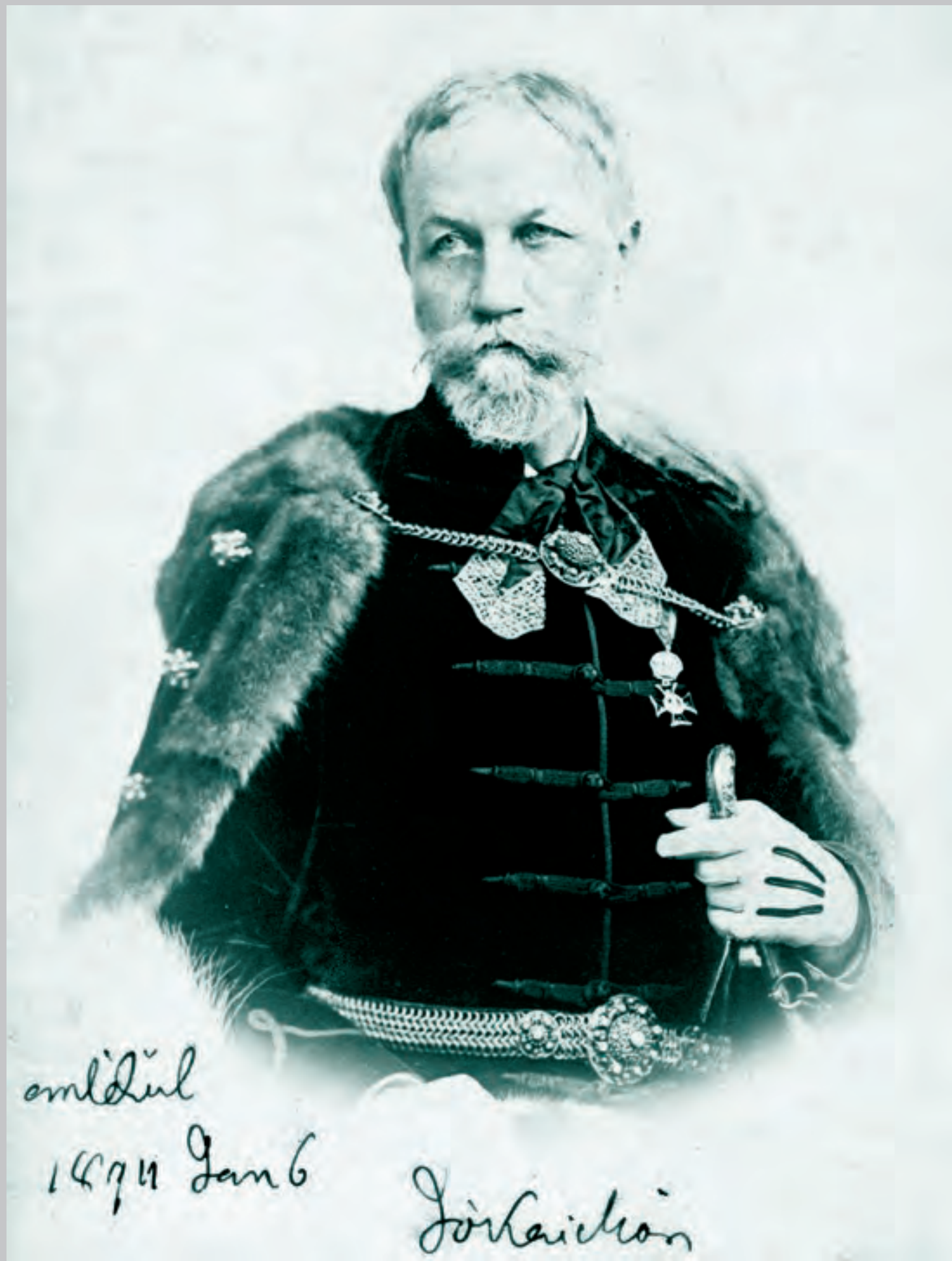
Jókai Mór (1894)