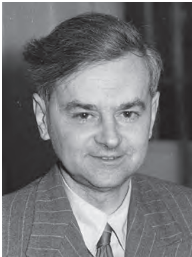
Weöres Sándor (1965)

Kodály korán felfigyelt Weöres Sándor tehetségére: „Weöres Sándor verseiben még mindig csörgedezik valami a magyar ritmusból, ő egyike annak a kevés magyar költőnek, aki sejti, hogy a magyar versnek nem szabad elszakítani a szálait, ami a magyar muzsikához köti” – nyilatkozta róla. Az akkor még szinte ismeretlen fia-