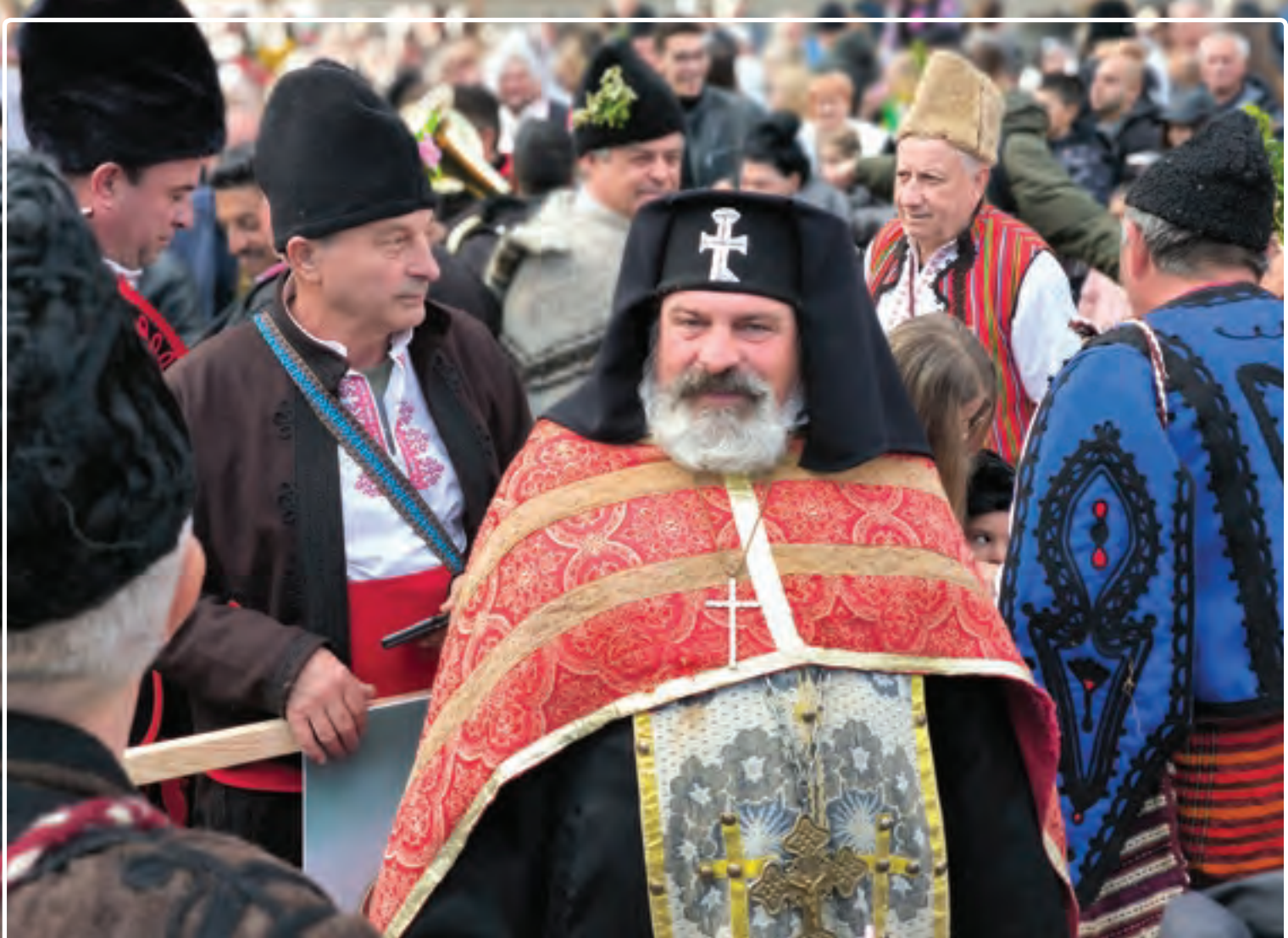
Surva Fesztivál 2025, Pernik, Bulgária