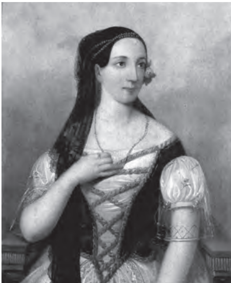
Orlai Petrich Soma: Laborfalvi Róza

azt az örömet, hogy egyéb élvezettel is traktálják napközben, mint zongorázással; egy magyaros ízű ételnek nem bírnak alkotói lenni, ha csak a nevelő-intézetből kikerülve, még valami jó falusi nagynéne kezei alá nem jutottak, hogy egy kis élni való tudományt is szerezzenek. Fel tehát hazám hölgyei, kik az általam elsorolt, vagy még nem ismert eredeti magyar ételek készítésének titkait bírjátok; jegyezzétek azokat fel, akármilyen orthographiával, nem kell azt versbe szedni, se czifrázni; küldjétek be a Vasárnapi Ujsághoz; én azokat összefogom gyűjteni s mikor együtt lesznek, ellátom ékes előszóval, és kiadom e czím alatt: »Valódi magyar szakácsnék könyve«. Hadd legyen valahára egy művem, a miről hálásan emlegessen meg a késő utókor.”