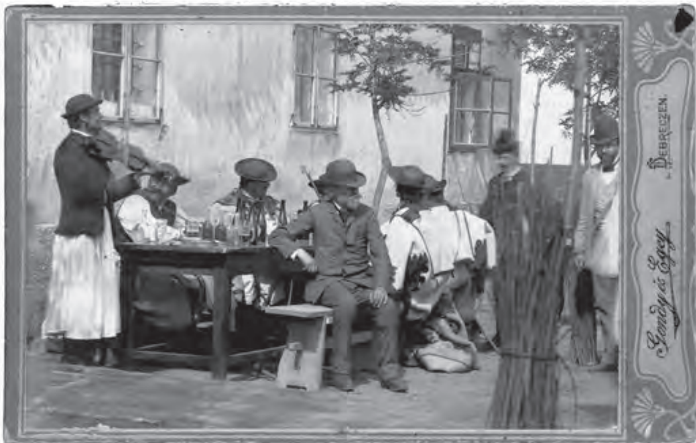
Jókai a hortobágyi csárda udvarán Rimóczi Lajos hegedűjátékát hallgatja (1889. május 21.)

És valóban, Jókai ott volt a Magyar Néprajzi Társaság megalakulásánál, amelynek védnökségét éppen az ő közbenjárására vállalta el Rudolf főherceg. A korán elhunyt trónörökös kezdeménye-