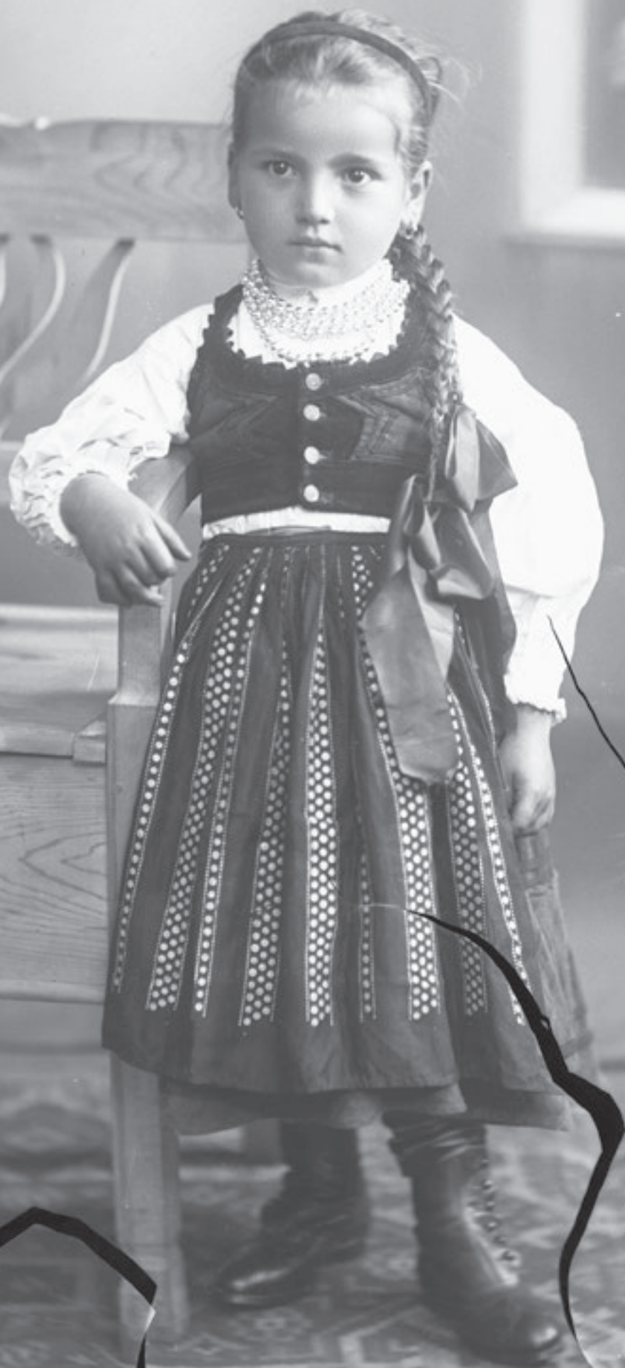
Kováts István: Brok Ilona Székelyderzsről Székelyudvarhely (Székelyföld, Udvarhely vm., 1910-es évek) Néprajzi Múzeum F 65281