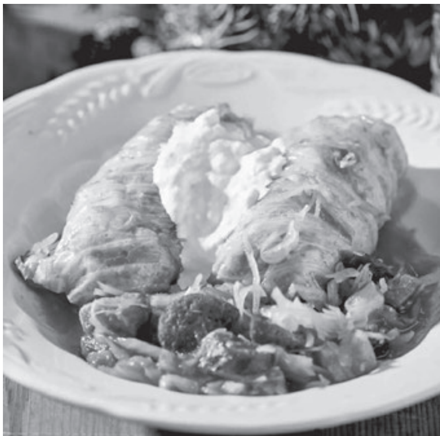
Savanyú káposztás karácsonyi töltött káposzta

Gundel Károly: Kis magyar szakácskönyv . Átdolgozták fiai, Gundel Ferenc és Gundel Imre, Budapest: Corvina, 2007.