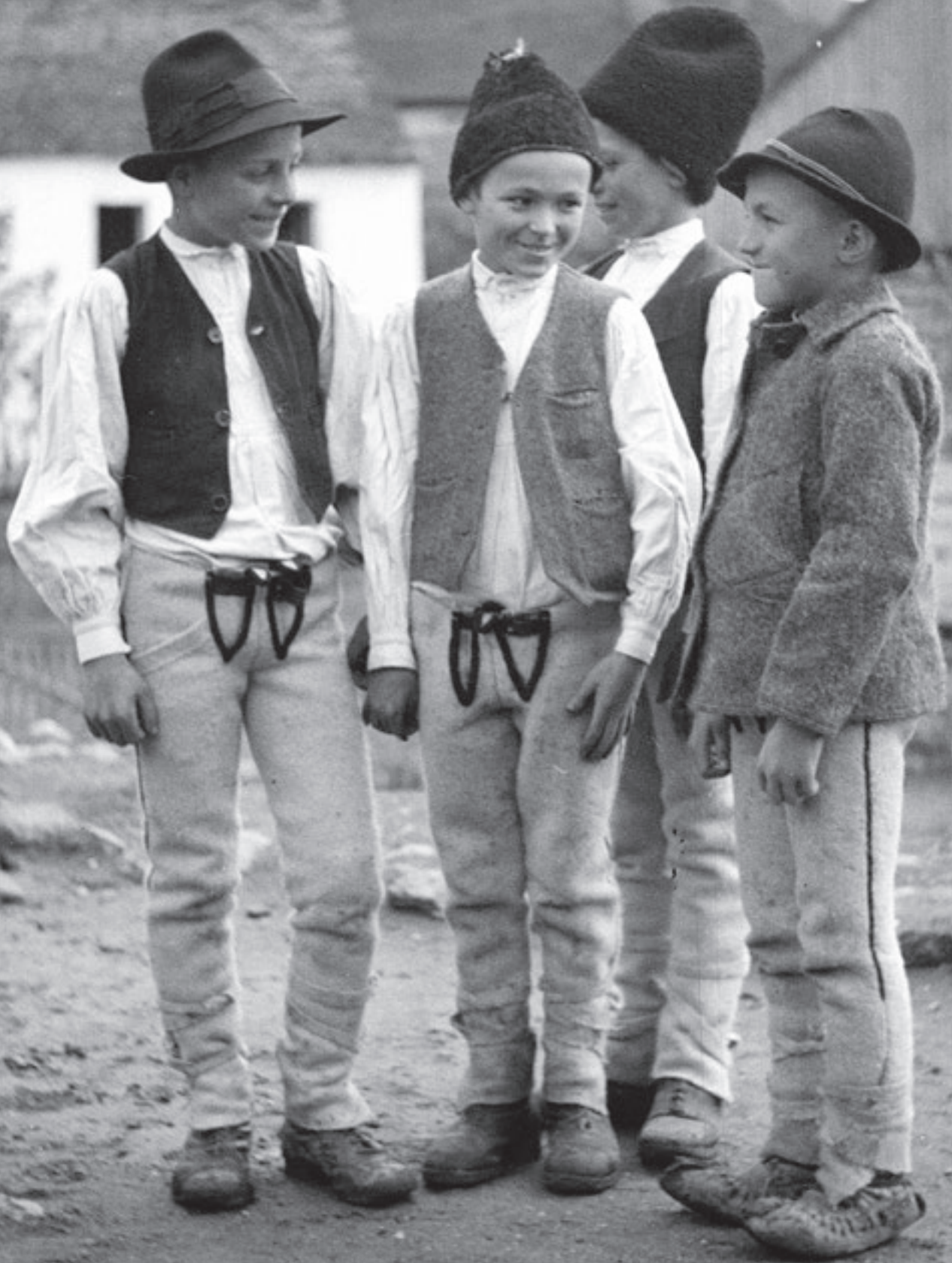
Gönyey Sándor: Legénykék Lövete (Székelyföld, Udvarhely vm., 1940) Néprajzi Múzeum F 87179