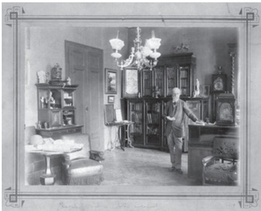
Jókai Mór a dolgozószobájában

„– Nos, Pál úr, mi ma az ebéd? – kérdi a hazaérkező kapitány [ Baradlay Richárd ], kardját leoldva oldaláról, s fegyvergyűjtemé-