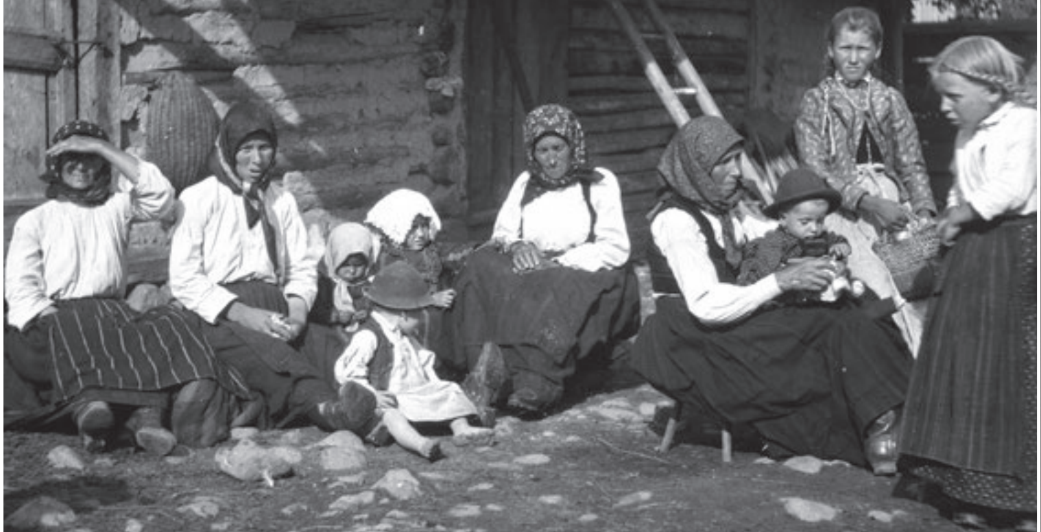
König György: Asszonyok gyermekekkel Siklód (Székelyföld, Udvarhely vm., 1903) Néprajzi Múzeum F 50498