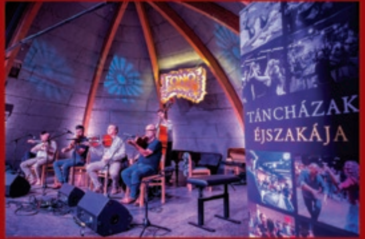
Tánc házak Éjszakája 2025