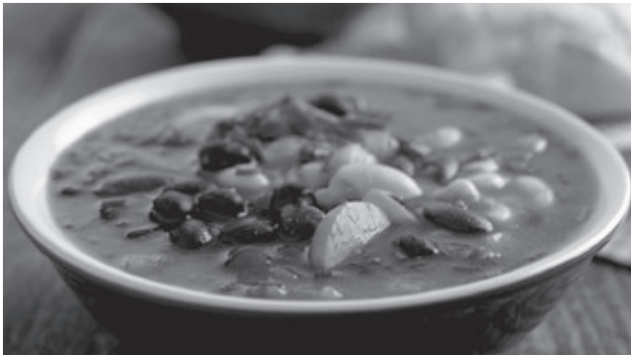
A Gundel-féle Jókai-bableves (forrás: Új Köznevelés, 2025/1-2)

Jókai második feleségének írt, A konyha című versében (melyről legközelebb részletesen is szó lesz) szerepel a következő két sor: Hát a fölségesnek hitt töltött káposzta! / Ki beteg szabónak halálát okozta... Ez egy Jókai korában közismert anekdotára való utalás, amelyet többek között Mikszáth Kálmán is lejegyzett egyik cikkében: „a pozsonyi doktor nagyon megjárta, midőn látta, hogy a kolozsvári hideglelősök a töltött káposztától gyógyulnak meg, s bejegyzé diariumjába, hogy a töltött káposzta orvosság a hideglelés ellen ; mert alighogy a pozsonyi patiensse még jobban megbetegedett, a dus tapasztalatot ekként kellett módosítania: a kolozsvári embernek orvosság, de a pozsonyinak halál .” Az anekdota szállóigévé vált alakját Jókai több művében is felhasználta. Az Utazás egy sírdomb körül című utóleírásban: „Azonban hozzá teszem, a mit a falusi kuruzsló feljegyzett a hideglelés-gyógyító töltött káposztáról: hogy ez kovácsnak orvosság, szabónak: halál .” A Szeretve mind a vérpadig című regényben Ocskay mondja doktor Wolffiusnak: „Izzadást rendelt, meg érvágást. Az izzadás megvolt nálam, az érvágást meg én tettem meg másom. Probavi et successit. Ezt is beírhatja a receptkönyvébe, hogy kovácsnak orvosság: szabónak halál .”