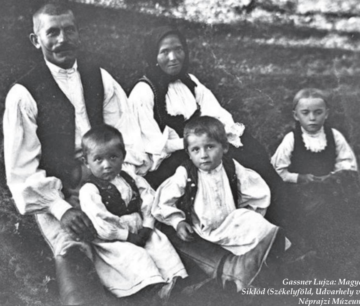
Gassner Lujza: Magyar család Siklód (Székelyföld, Udvarhely vm., 1911) Néprajzi Múzeum F 2606b