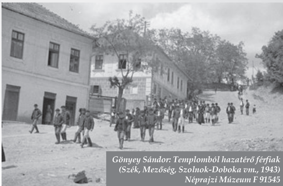
Gönyey Sándor: Templomból hazatérő férfiak (Szék, Mezőség, Szolnok-Doboka vm., 1943) Néprajzi Múzeum F 91545

De vajon boldogultak? A szó igazi jelentése értelmében, alig- ha. De azért itt maradtak. Mi mást is tehettek volna?! Tudomás- sul vették, hogy itt is sajátos törvények vannak, akárcsak ná-