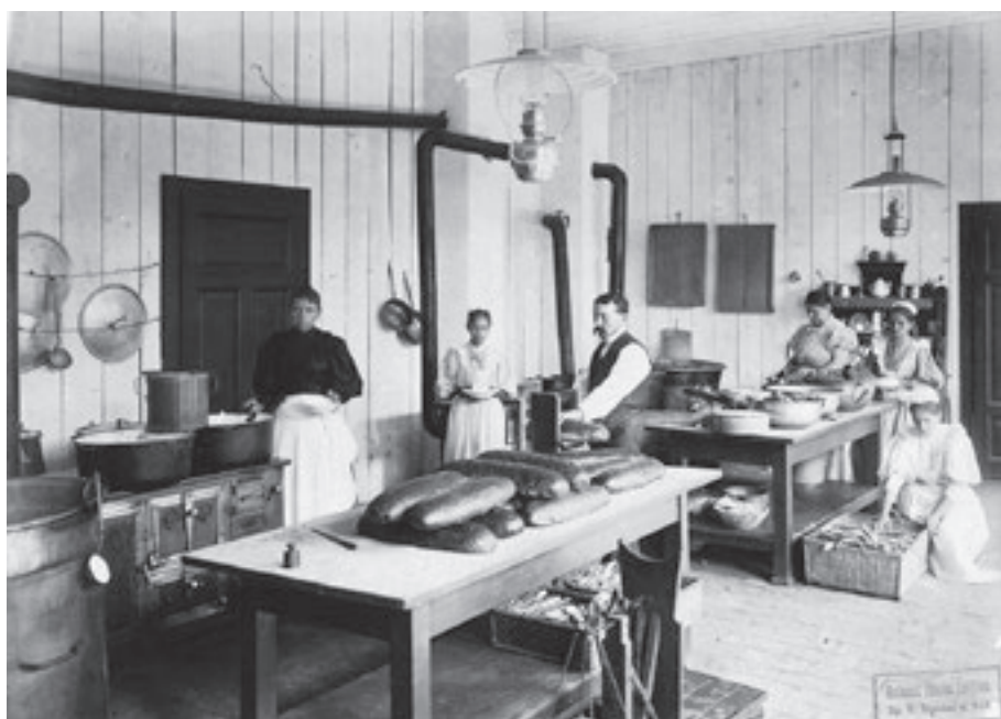
Konyha a Millenniumi Kiállítás barakktelepén.

Apríts össze egy font (56 deka) fiatal disznóhúst s egy darabka szalonnát, tedd mendenczébe, adj hozzá egy marok megmosott rizskását, egy kis sót és tört borsot s két egész tojást, keverd mind ezt jól össze; végy aztán káposztaleveleket, vagdald ki belőlök az ereket s töltsd beléjük a feljebbi-eket, csináld jól össze s tedd finom metélt káposztával fazékba, tedd tűzhöz s hagyd egy pár óráig főni. Csináld azután vékony világossárga rántást, tégy bele egy kevés aprított vöröshagymát, pergeld meg, add hozzá a káposztát is, s hagyd még legalább egy óráig főni; a tálalás előtt fertály órával fél meszely tejfelt adj hozzá; ha az asztal-