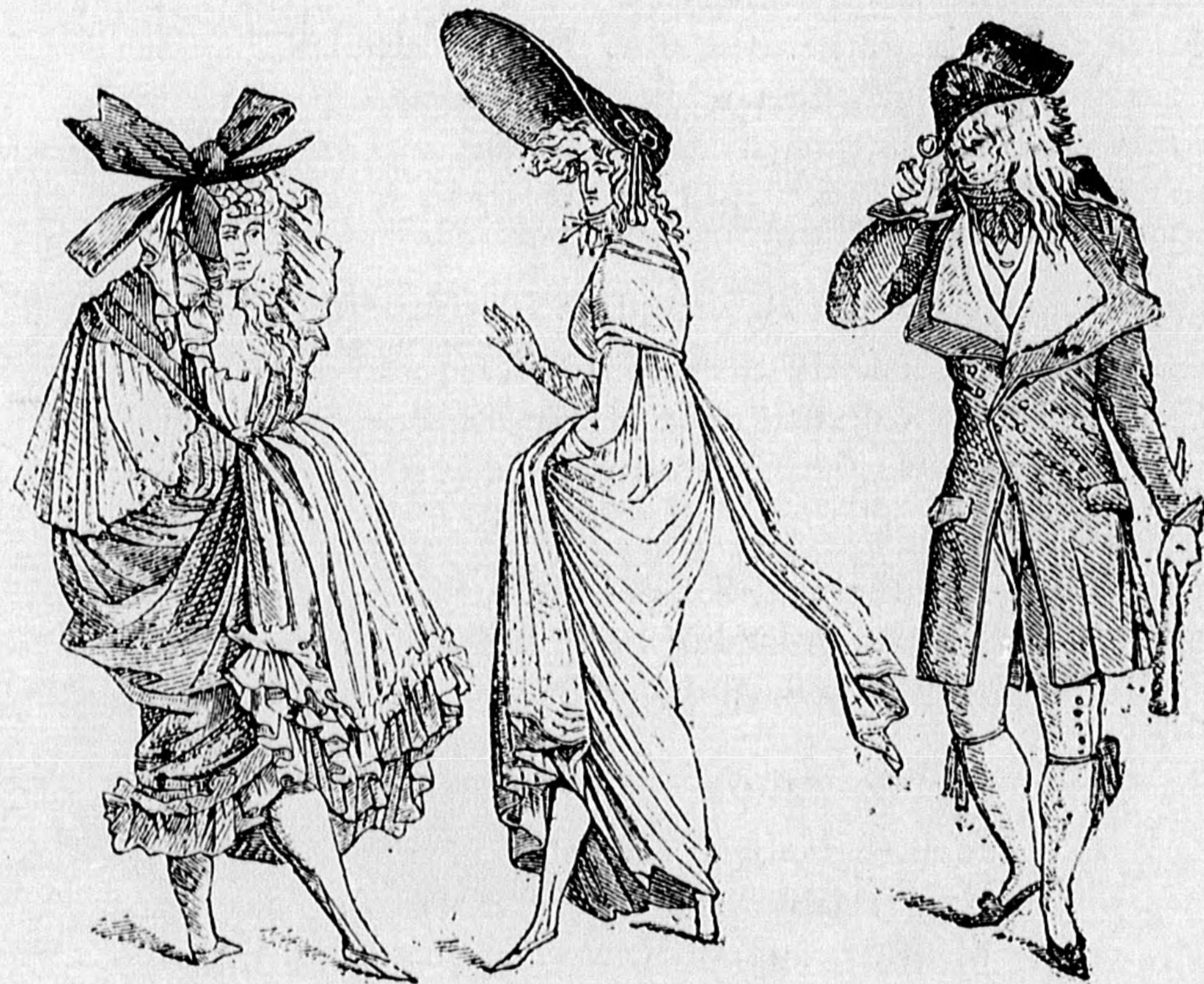
A divat száz év előtt.

A vándorköpeny iránti előszeretet annyira gyökeret vert ifjú hölgyeinknél, hogy ettől még a nyári évad alatt sem hajlandók megválni. És meg kell adni, hogy ez jó izlésre mutat, mert alig