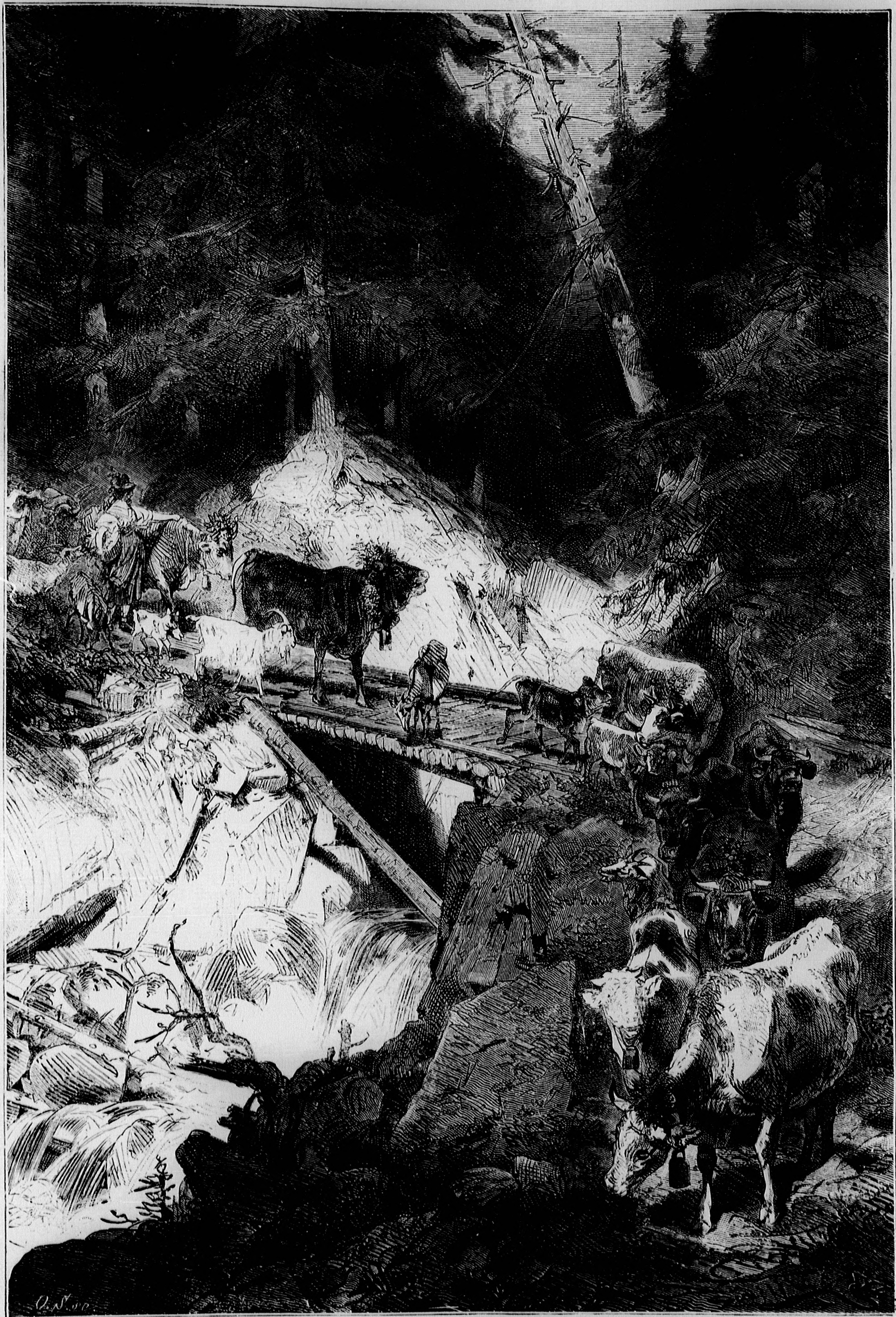
HAZATÉRÉS AZ ALPESEKRŐL.