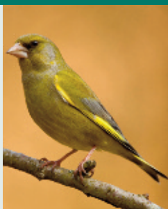
A zöldike ott koncertezik előszeretettel ahova télen odaszokott

A tavasszal együtt a madárcsicsergős reggelek is megérkeznek. Bár az időjárás egyelőre még a bolondját járhatja velünk, márciusban már megjelennek az első énekesmadarak a kertekben.