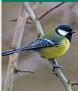
A széncinege az első énekesmadár, aki jelzi a tavasz megérkezését