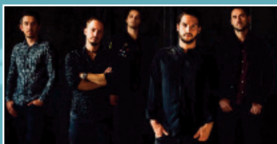
Bagossy Brothers Company