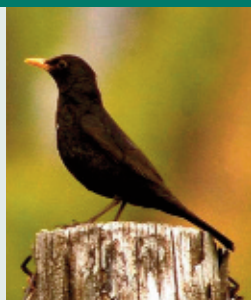
A feketerigók közül a hímek kora reggel és este trilláznak