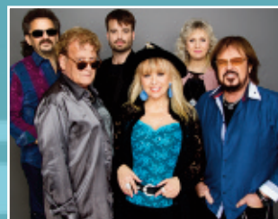
Neoton Família Sztárjai