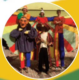
Vaga Banda Gólyalábasok