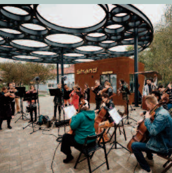
Vác Civitas Szimfonikus Zenekar