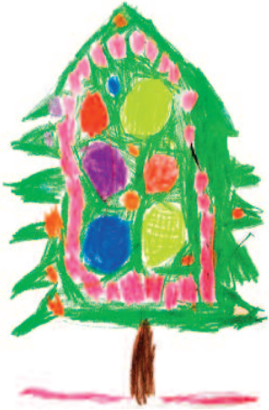
Lomen Ádám rajza

Úgy, hogy kikapcsolódás helyett a bekapcsolódás idejének kell tekintenünk őket. Bekapcsolódunk a természetben működő