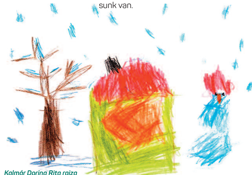
Kalmár Dorina Rita rajza