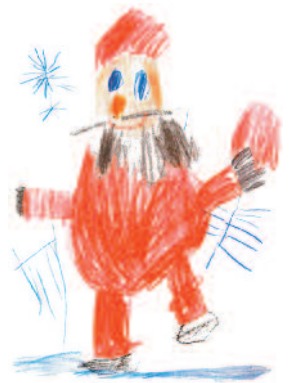
Dudoli Linett rajza