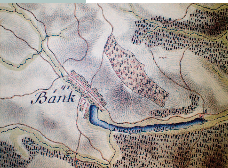
Az 1782-85 között készült térképen jelzik Bánk 25 hektáros szőlőtermő területét