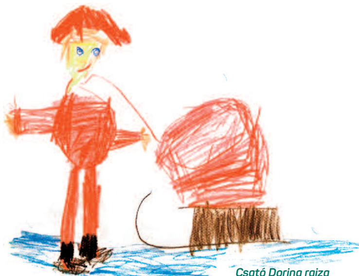
Csató Dorina rajza