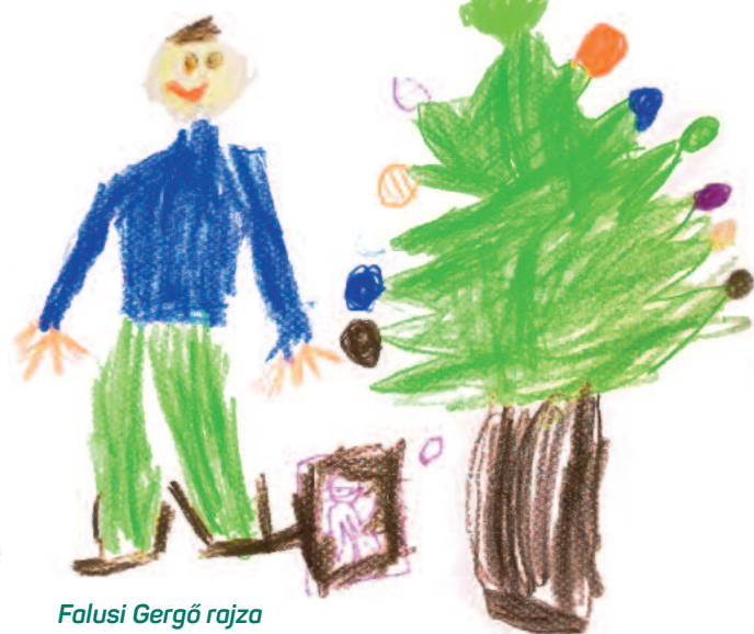
Falusi Gergő rajza