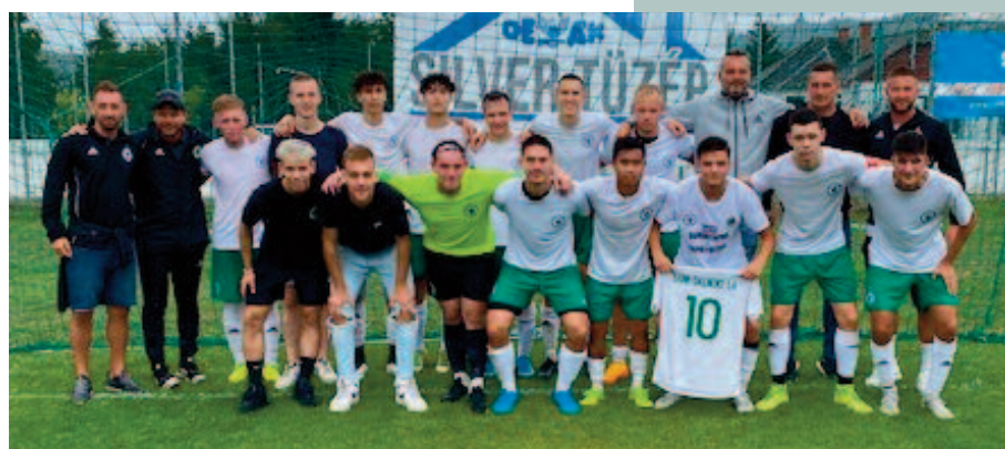
Bánk-Dalnoki LA Megye I csapata