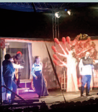
A falu rossza zenés színmű nagy tetszést aratott