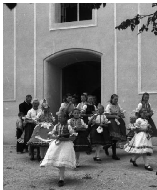
A Bánki Evangélikus templom korabeli felvételeken