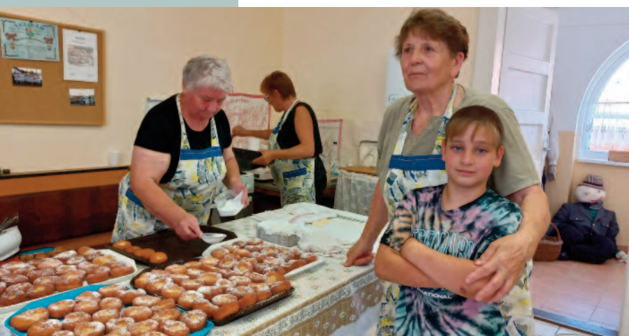
Készül a hagyományos farsangi fánk

A nyáron tábori helyszínek biztosításával is gazdagítottuk programjainkat. Az Erzsébet tábor három turnusában ismertettük meg a táborozókat (köztük bánki gyerekeket is) a még élő hagyományainkkal. Megismerhették elődjaink életét a tájházban, majd a „mamák” segítségével bepillantást nyerhettek a régi ételek készítésébe a fánk sütésével. Közben kérdéseikre is válaszokat kaptak a régi gyerekek életéből, játékaikról. Szlovák dalokat is tanultak, miközben kézi csomózással készítettünk karkötőket.