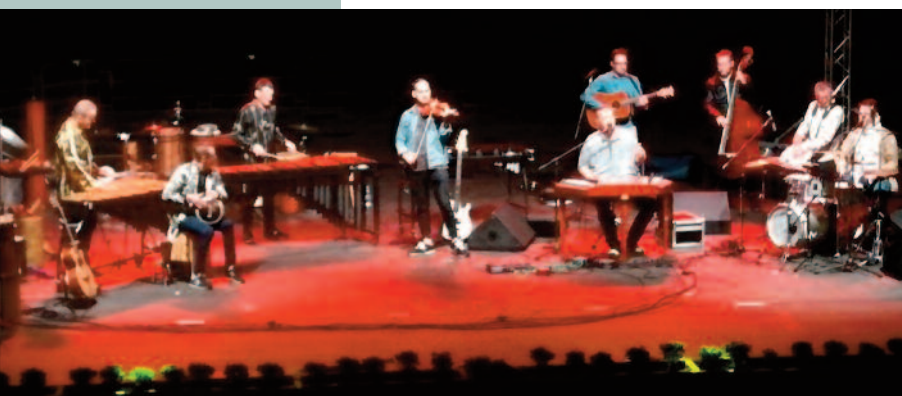
Cimbaliband és Talamba világzenei körutazása

Bátran állíthatjuk, hogy idén is nagy elszántsággal indultunk neki a Bánki Nyár 2022 programsorozatnak. Úgy gondoljuk, sikerült egy színvonalas és változatos műsort összeállítani, neves előadókat és zenészeket megnyerni a fellépésre, az egyedi hangulatú és páratlan szabadteres színpadunkra.