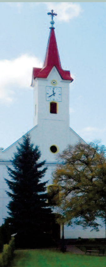
A Bánki Evangélikus templom napjainkban

„Ez az orgona építtetett a bánki volt úrbéresek adományából s több jótévő hozzájárulásával 1892-ben 880 Forintért Jagerdorfban, a Rieger testvérek világhírű gyárában, pedálklaviatúrával, de pedálsípok nélkül. A hiányzó pedálváltozat, Subass 16, betéttett 1905, Riegernek budapesti gyára által 172 Forinton. Dicsőítem az Ura-