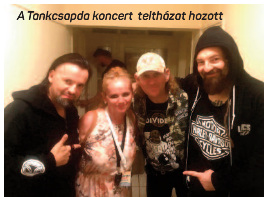
A Tankcsapda koncert teltházat hozott

A legendás Tankcsapda zenekar lassan már úgy jön hozzánk, mintha haza érkezne. A közel teltházás koncertre számtalan rajongó érkezett és bulizta végig az estét. Felejthetetlen élmény volt idén is.