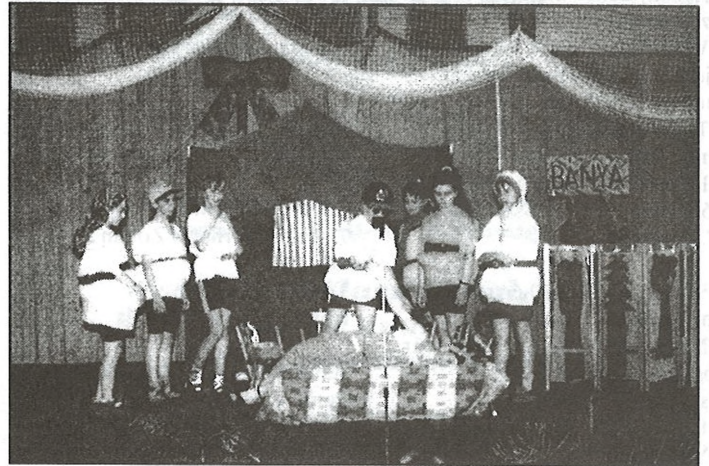
A II. helyezett 5. b osztály

Június 6-án 17 órakor a tornacsarnok-rendezvényházban Iskolaest volt. A gyerekek felkészítő tanáraikkal és segítőikkel együtt sok munkát és energiát fordítva a felkészülésre, kellemes pillanatokat szereztek szüleiknek és hozzátartozóiknak.