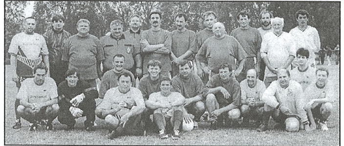
A balástyai öregfiúk és a szegedi újságírók csapata: