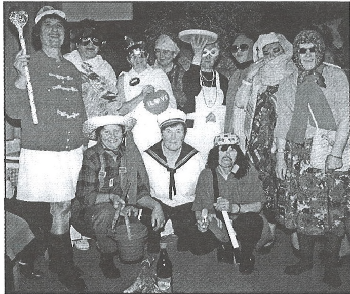
Március 8-án ötletes jelmezekben, vidáman farsangoltak a nyugdíjas klub tagjai.

2000. április 20-án, 14 órától a Nyugdíjas klubban: