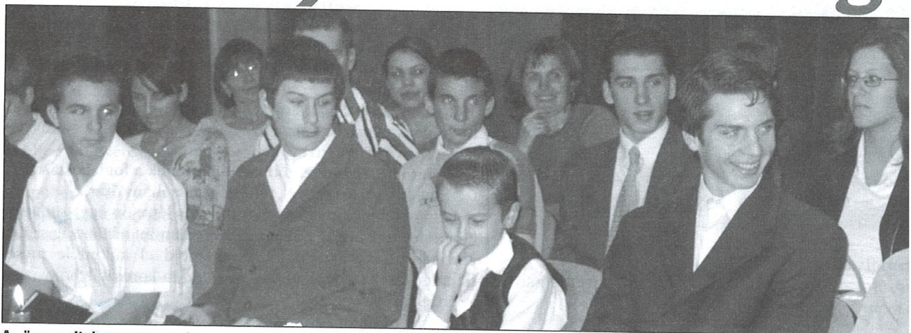
Az ünnepeltek egy csoportja

Kellenek az ünnepek az életünkbe, amikor megpihenünk, és teljesítményünket összegezhetjük. Ezért is kértem a Balástya Község Közművelődéséért és Fejlődéséért Közalapítvány kuratóriumát, hogy most, a Balástyai Újság utolsó száma előtt rendezzenek ünnepséget az „Akikre büszkék lehetünk” rovatban éveken át szereplő, országos és külföldi versenyeken díjakat nyert gyermekeknek és fiataloknak, akik községünk hírnevét öregbítették.