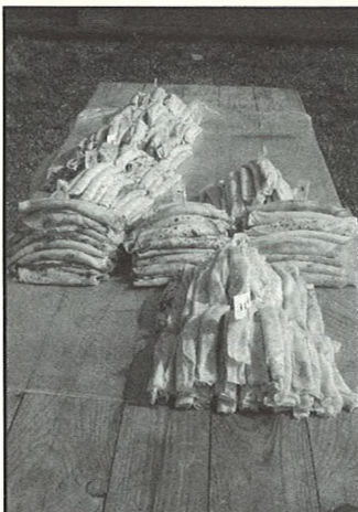
Az utolsó számjegy a palacsintás évszámából