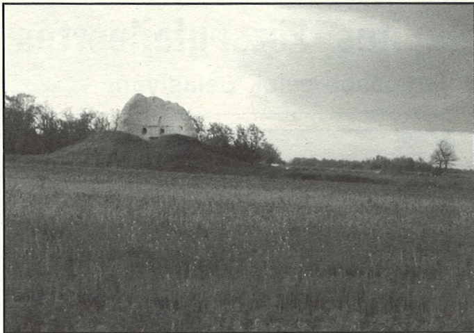
Itt, a volt malom közelében fut majd az M5-ös nyomvonala