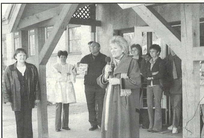
Látogatóban az ÁMK-ban