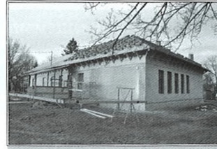
Megújul a Teleház épülete. A tetőszerkezet javítása, a cserepezés és vakolás után rövidesen a díztégla-burkolás és a homlokzat festése következik.

A téli csapadék nagy mennyisége miatt néhány hétig Balástyán másodfokú belvízvédelmi készültséget kellett elrendelni. Ezt alapos indokok támasztották alá elsősorban a tanyavilágban. A belterületen a belvízelvezető csatornákból a belekerült hulladékot, növényi maradványokat kitarakták az önkormányzat dolgozói, és főleg az átereszeknél, hogy ne torlódjon fel a víz. A csatornák levezető, gyűjtő részén, ami a külterületre a vizet elvezeti, önkormányzati géppel, és vállalkozói segítséggel a vízelvezetését megoldottuk. Ennek a nehezen túl vagyunk. Néhány külterületi szakaszon nagyobb probléma volt a belvíz elvezetés, és főleg ott, ahol magántulajdonon keresztül megy a belvízelvezető csatorna. Néhány helyen eltömődött, vagy átjárót építettek rajta, és nem raktak átereszt. A munkálatok zavartalan lebonyolítása érdekében napi kapcsolatban voltam az Alsó-Tiszavidéki Környezetvédelmi és Vízügyi Igazgatósággal, és a Kiskunmajsai Vízgazdálkodási Társulattal. A csatornák kotrása jelenleg is folyamatban van, mára a másodfokúról első fokúra csökkenthetjük a készültséget. Jelenleg napi területbejárásokat tart a gátőr, és az önkormányzati dolgozók, tanyagondnokok, településőrök segítenek abban, hogy ezt a problémát mielőbb megoldhassuk.