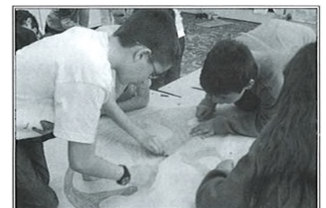
Föld napi plakátkészítés