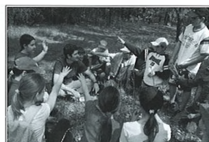
Túra a Kapitánysági erdőbe