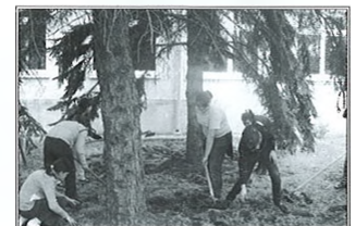
Kert takarítás az iskolában