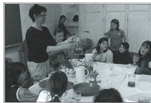
Gyógytea bemutatás és kóstoló