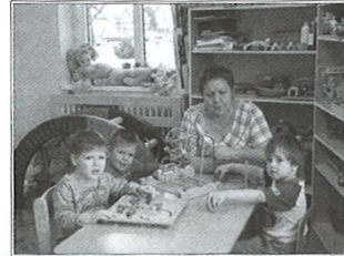
Március 1-től a családi napközi bölcsődés korú csoportja átköltözik az új bölcsőde épületébe.

December közepén megkezdődött egy olyan beruházás Balástyán, amelynek a beruházója az önkormányzat, de a Balástyáért Közalapítvány a pályázat lebonyolítója. Mivel közhasznú civilszervezet a pályázó, így az áfat nem kell befizetni,