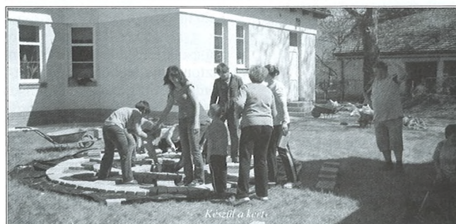
Készül a kert