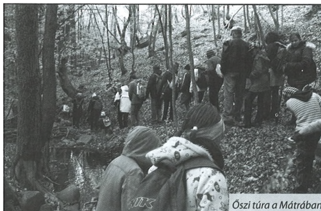
Őszi túra a Mátrában