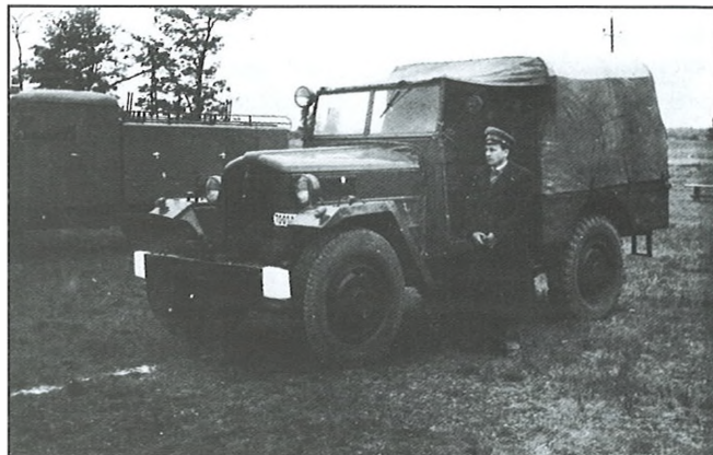
Az első tűzoltóautó. Kezdetben a Községi Tanács lovasfogatóval vontatott lajtos kocsival oltották a tüzet