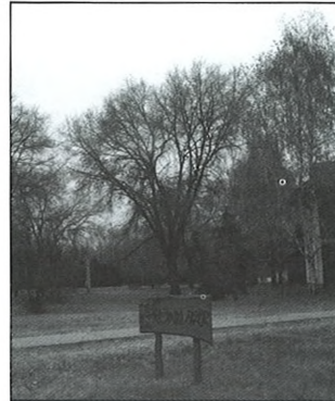
Az általános iskola alsós épülete, és a könyvtár előtt épül majd a közpark

A korábban elkezdett projekteinket lényegében lezártuk, a két külterületi útépítést, a csapadékcatorna beruházást, az iskola felújítást, korszerűsítést, könyvtárfejlesztést, korábban