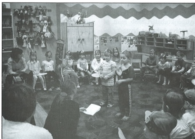
Műsor a Napocska csoportban