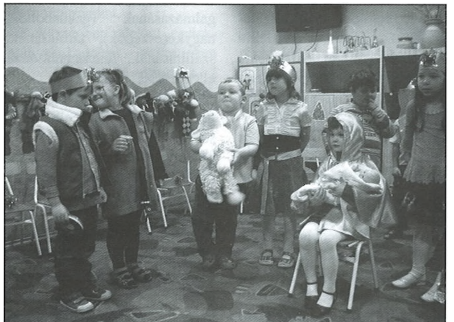
Betlehemes jelenet a Csillag csoportban