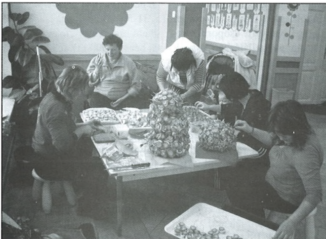
Uzsonnakészítő anyukák a Csillag csoportban