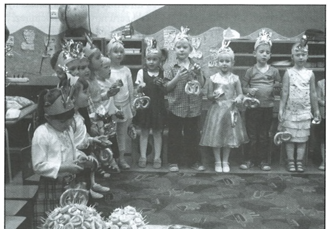
Műsor a Felhőcske csoportban