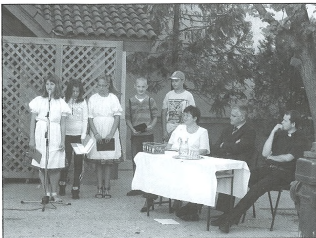
A hatodik osztályosok műsora

radírral köszöntötte az elsősöket, majd megnyitotta a 2012-13-as tanévet. Az ünnepségen vendégünk, Ujvári László polgármester beszélt az intézményt érintő változásokról és sikeres tanévet kívánt iskolánk minden tagjának. Az ünnepélyes tanévnyitó Forgó Miklós plébános Veni Sancte tanévnyitó miséjével zárult.