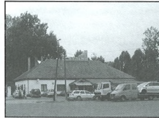
A Vadásztanya Vendéglő üzemeltetésének átszervezése után önkormányzati intézmény lesz

tület, hogy létrehozzuk az ÁMK szervezetét, mert egy intézmény együttesben, egy vezetővel, a karbantartás, javítás, az összes működtetési kiadás kevesebb.