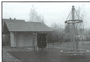
A Hunyadi utcai játszótér felújítása, szabadidős sportparkká átalakítása befejeződött.

A beruházás pénzügyi háttere ugyanolyan fontos, mint az, hogy jól haladnak a munkával a kivitelezők. December 17-én a Probart Kft. az eddig elvégzett, műszaki ellenőr által jóváhagyott munkája és pénzügyi ütemterve alapján benyújtott számláira a munkadíjat megkapta pályázatból és a befizetett önerőből. Szerencsére eddig a Víziközmű Társulatnak nem kellett hitelt felvenni, de a bankkal megkötött hitelszerződés ügynevezett rendelkezésre tartási állományban van, és a kamatokat így még nem kell fizetni. Később majd természetesen fel kell venni belőle. Ez mutatja, hogy jónak mondható a lakossági befizetések beérkezése, illetve a korábbi kisebb összegű kifizetéseket az önkormányzat meg tudta előlegezni. Továbbra is tisztelettel kérek mindenkit az érdekeltségi hozzájárulás pontos befizetésére. Tisztában vagyok azzal, hogy ez mekkora anyagi terhet jelent a lakosságnak, de sajnos e nélkül nem tud megvalósulni a beruházás. Egyenlegközlő levélben tájékoztatunk mindenkit, hol tart a befizetésekkel. Akinek egyébként a befizetésekkel kapcsolatban problémája van,