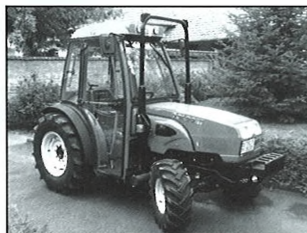
Megérkezett a Start Minta Munkaprogram támogatásával vásárolt új traktor

A szeptember 11-én tartott képviselő-testületi ülésen tájékoztattam a képviselőket a szennyvízberuházás jelenlegi állásáról a próbaüzemeltetéssel és a rákötésekkel kapcsolatban. A szennyvízberuházás kezdete óta két támogatást is nyertünk a költségek csökkentésére, a Környezet és Energia Operatív Program (KEOP) támogatás intenzitás növelése, illetve a BM EU Önerő Alaptól is kaptunk további segítséget, ezáltal változik a szükséges lakossági önerő mértéke. Ennek kiszámításáról, az elszámolás módjáról tárgyalt a testület. A döntést majd ez