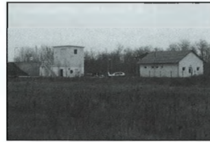
A szennyvíztisztító telepet működés közben március 26-án tekintheti meg a lakosság

Megnyertük a tanyagondnoki szolgálat járműparkjának korszerűsítésére beadott pályázatot, amellyel egy kilenc személyes kisbuszt és egy terepjáró személyautót vásárolhatunk a tanyagondnoki szolgálatnak. A beruházás 15 millió forintos, 100 százalékos támogatottságú, és csak a 4 millió forint áfát kell fizetni az önkormányzatnak. Nagyon nagy hiányt pótol ez a beszerzés, mert a tanyagondnoki szolgálatban dolgozó munkatársak jelenleg olyan járművekkel végzik a feladatukat, amelyekkel 70-80 százalékban dűlőutakon több százezer kilométer tettek már meg a nagy távolságok miatt. A régi autók