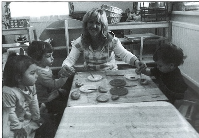
Húsvéti készülődés a Süni csoportban

önkormányzat támogatásával közel 100 kisgyermekről gondoskodott az intézmény hét dolgozója.