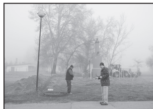
Elkészült az iskola hátsó bejáratnak világítása

A Vidékfejlesztési Programok „LEADER – Helyi fejlesztési stratégiák elkészítésének támogatása” című felhívásban van egy pályázati lehetőség gépbeszerzésére. Szeretnénk egy háromtárcsás függőleges