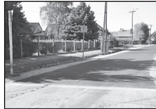
A Kóródy utca egy szakasza is megújult.