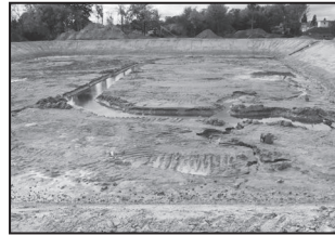
A Gajgonyai záportározó építése a befejezéshez közeleg.

A közvilágítási lámpatestek energiatakarékosra cseréje befejeződött minden utcában. Összesen 276 darab ledes fényforrást szereltek fel. A műszaki átadás folyamatban van, és novemberben lezárul. Ezután kell a szerződés szerint a bekerülési költséget kiegyenlíteni. Ismét hangsúlyozom, hogy az önkormányzat saját költségvetéséből finanszírozta a beruházást, ami