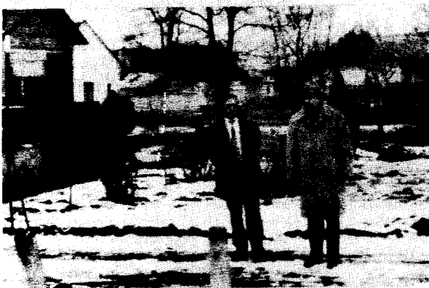
• GÁZFÁKLYA • GYÚJTÁS A KASZINÓ TÉREN 1992. január 28-án