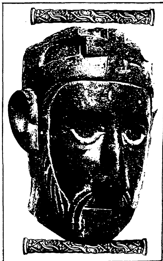
A kalocsai székesegyházból származtatott XII. század végi királyfej minden valószínűség szerint István királyt ábrázolja.