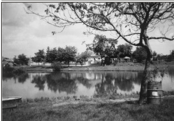
Szabó Renáta: Hulladékgyűjtő