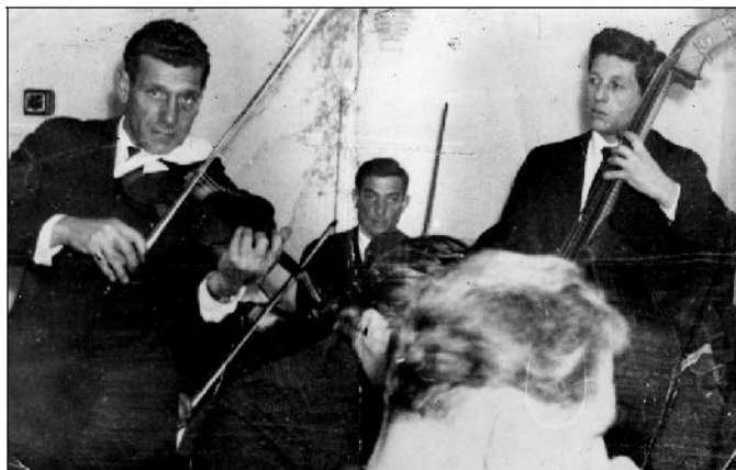
Pályája kezdetén a bögő mellett brácsán is muzsikált (a kép bal szélén)

feladatot rám bízták, így én vittem a hangszert a lagzikba. Ott ültem a zenekar mellett és lelkesen figyeltem az öregek minden vonóhúzását a hegedűn. Tanítani nem tudtak, mert ők is ösztönösen muzsikáltak; a hangokat, kottát nem ismerték.