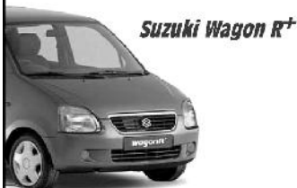
Suzuki Wagon R +