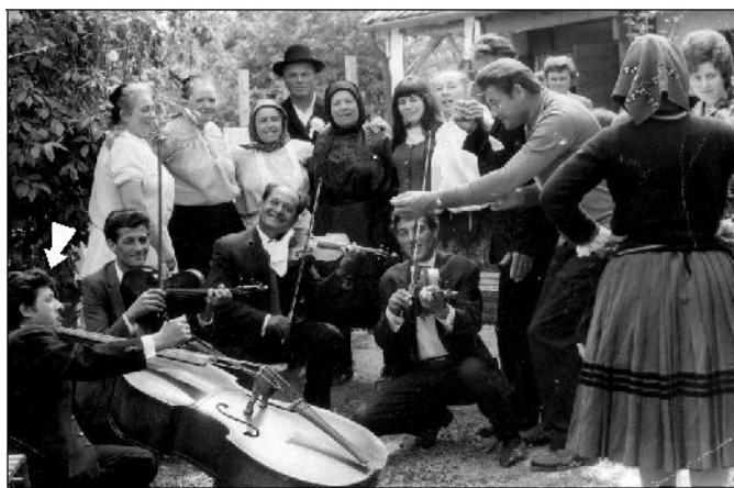
Zenekarával a lagzik, eljegyzések és más családi rendezvények elmaradhatatlan szereplője volt

fárasztó volt. A nyolcvanas rögzítette a muzsikálásunkat, évek végétől Zsámbokon így arról betanulják, hogyan „csak” a mûlagzi maradt. A kevesebb zsámboki felkérés miatt Turán a Baranyi-féle