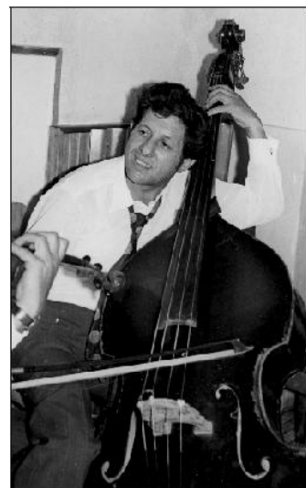
Fő hangszerével, a bögővel

- Természetesen, csak közben megnősültem. Az apósom is muzsikus volt, ráadásul brácsás. Ameddig nem jutottam el iskolába, ő tanított. Látta, hogy amikor játszom, jó hangokat fogok le, csak nem tudom, hogy mit. Ő valamennyire értett a hangokhoz, ráírta és kis papír-