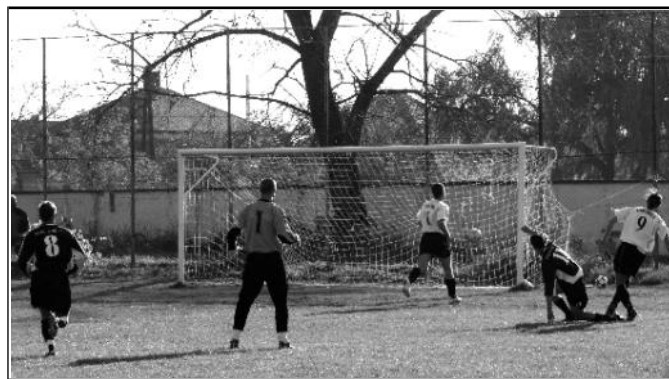
Nagy nagy hibájából született a kisbágyoniak első gólja

Igazából engem nem győzött meg a magyargéci csapat arról, hogy jogosan foglalják el a tabella első helyét. A brazil „csodajátékosok” sem nyűgöztek le