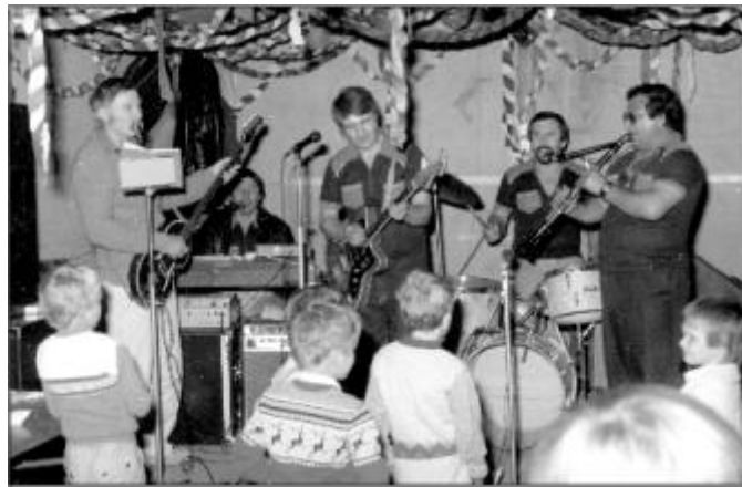
Az egyik lagzis zenekarban, a dobok mögött

- Soha nem válnék meg tőle. Igaz, hogy vettem egy újabb felszerelést is, de az elsőt is megöriztem. Azóta csend van, de egy szóra újra indulna minden. Bármikor, hívnának zenélni, azonnal vállalnám.