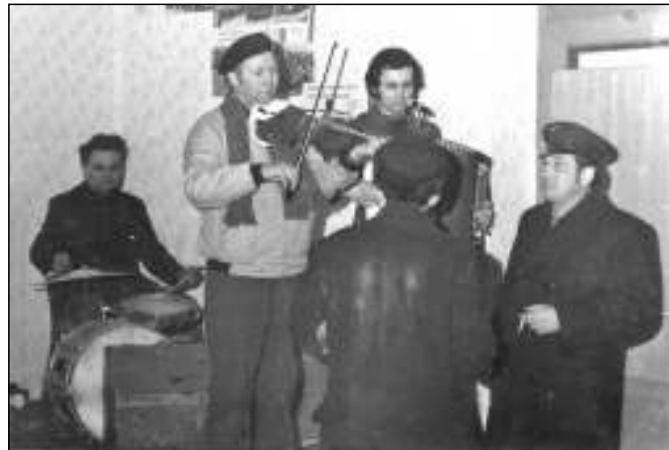
Az öregekkel vasutasoknak zenélnék