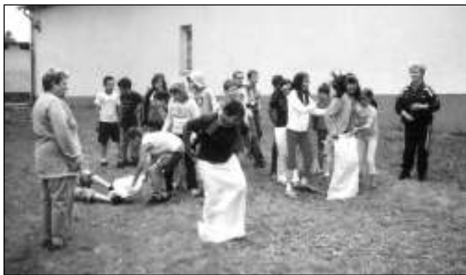
A gyermeknap alkalmából játékos vetélkedőket szerveztek a pedagógusok a Tabán úti iskola udvarán és a Kónya-parkban.