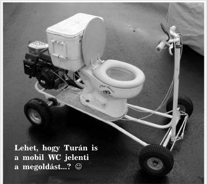
Lehet, hogy Turán is a mobil WC jelenti a megoldást...? ☺