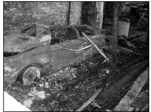
A Zsámboki úton február 2-án éjjel csaptak fel a lángok – ez lett az eredmény

2. 21:50 környékén egy, a Béke utcában lévő épület lobbant lángra.