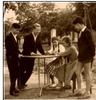
jobbra: „Szív küldi”-üzenet felvétele a piactéren