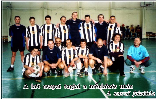
A két csapat tagjai a mérkőzés után

A meccset közös ebéd és vidám beszélgetés követte. A főgyártásvezető meghívta csapatunkat egy újabb összecsapásra