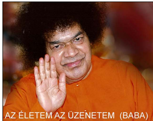
AZ ÉLETEM AZ ÜZENETEM (BABA)

Szinte szédülve nézelődök, lassan sodródok előre. Már egészen elől vagyok, mikor egy széva (segítő) int, hogy álljak meg. Na, gondolom, biztos ész-