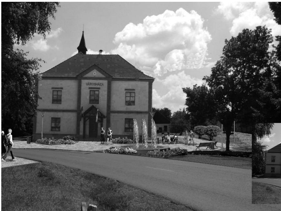
Polgármesteri hivatal előtti tér szökőkúttal, egynyári virágpadokkal