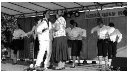
A népművészek mellett sok más műfajú tehetséges turai fiatal is van – Szabadstílusú focisták és Turali Komédiások