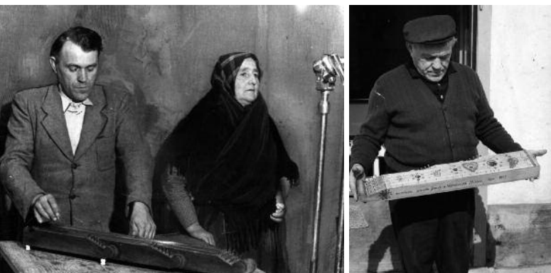
1953. Rádiófelvétel Jula néniel

– Ma már nem, de nincs okom panaszra. A jó Isten megengedte, hogy ilyen szép kort éljek meg. Volt ebben jó és rossz, is mint, minden embernek. Harminc éve a párom nélkül vagyok, a lányom egy éve nincs közöttünk. A fiamékkal lakom együtt, akik méhészkednek. Három unokám és két dédunokám van. Régen szegényebb élet volt, de nyugodtabb. Varrogatok, tévézem, a kertben motyogok, templomba járok. Szeretem ezt az őszi gyönyörű napsütést, feltölti a sokszor szomorú lelkemet. Szegényes, sanyarú gyerekkorom volt, de annál csodálatosabb, boldogabb életem lett a férjemmel és a gyerekeimmel. Ebben a rohanó világban nem is tudok mást mondani csak azt, hogy kívánok mindenkinek olyan szép életet, mint amilyet én eltölthettem a párommal!