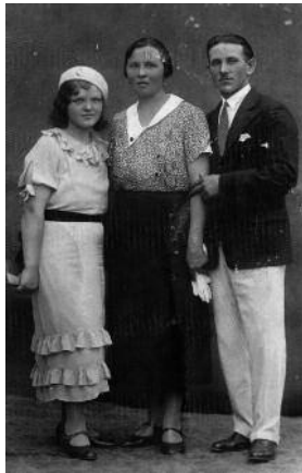
1935. Mariska néni megérkezett a nagyneniékhez