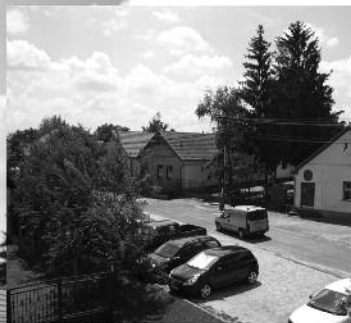
Többsincs Óvoda előtti terület parkolókkal, egynyári virágpadokkal