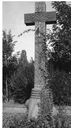
Anno Domini 2000, a Kónya-tónál

A világon egyedülálló és példát mutató 1956-os Foradalom és Szabadságharc emlékére, az ötven éves évfordulón, 2006-ban állítottak mementóként faragott fejfát a templomkertben, melyet minden évben ünnepélyesen megkoszorúznak. Itt kell megemlétenünk a Templom melletti kőoszlopon álló gyönyörű Szentháromság szobrot is, melyet a hívők Rózsafüzér Társulatának tagjai 2000. évben újjártak fel. Szintén az ezred-