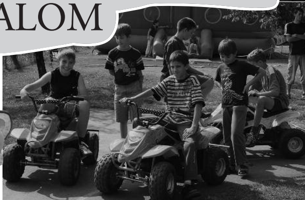
Változatos gyerekprogramokkal, rendhagyó módon, most a Többsincs Óvoda és Bölcsőde fogadta a kicsiket