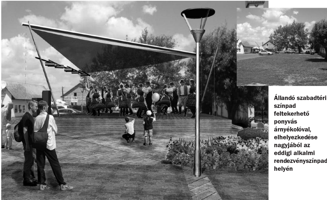
Állandó szabadtéri színpad feltekerhető ponyvás árnyékolóval, elhelyezkedése nagyjából az eddigi alkalmi rendezvényszínpad helyén