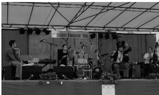
Vendégünk volt az Ifjú Muzsikás együttes is