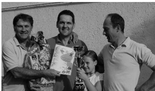
Mindig népszerű a főzőverseny, az ide győztes az Öregfiúk csapata a székeley- és a takartas káposztával