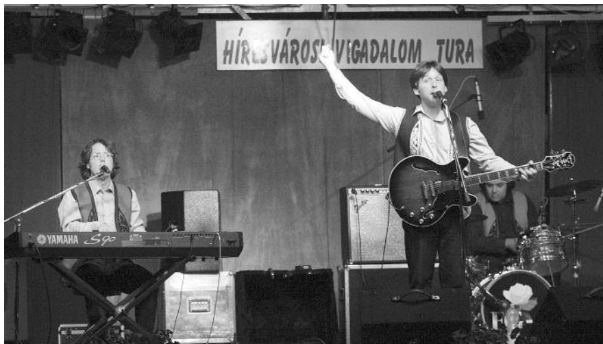
Sokak fiatalságát idézte az Illés-Fonográf emlékenekar, az FG-4